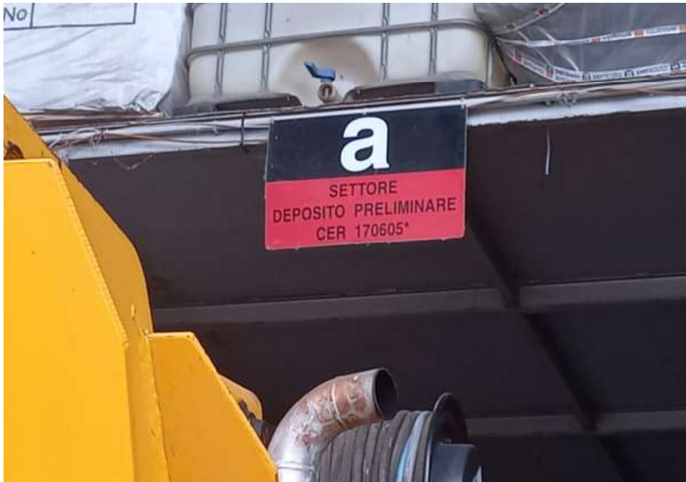
Cartellonistica area stoccaggio rifiuti