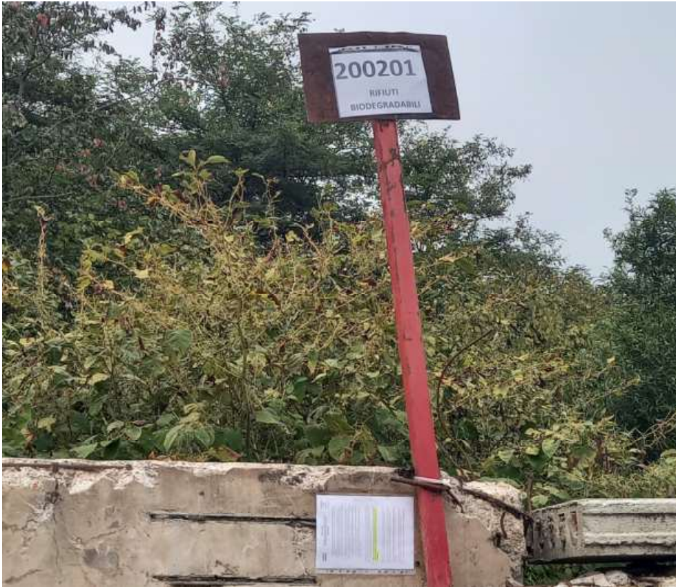
Cartellonistica area stoccaggio rifiuti e norme manipolazione rifiuti/contenimento rischi