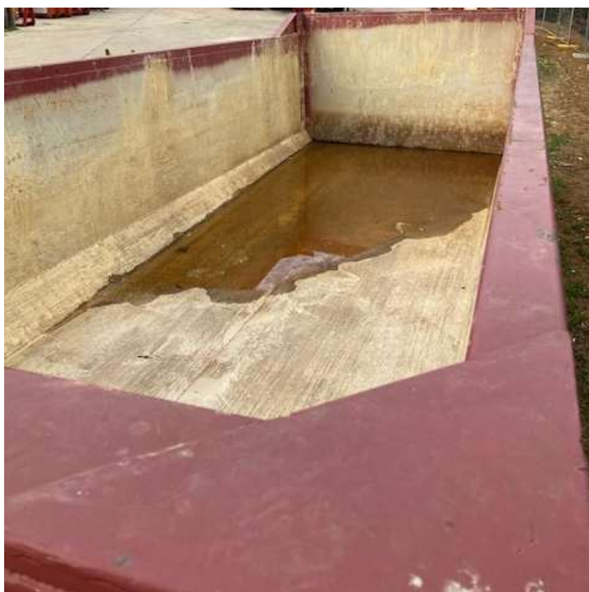
Cassone scarrabile a tenuta stagna che sarà utilizzato come bacino di contenimento per il posizionamento, al suo interno, di cisternette (IBC) da 1.000 litri cadauna, per stoccaggio CER 160708