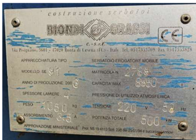
Cisterna BIONDI E GRASSI & C. SRL dotata di bacino di contenimento per stoccaggio CER 160708