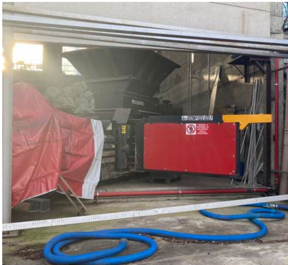
Apertura capannone (AREA A) con pressa Ing. Bonfiglioli