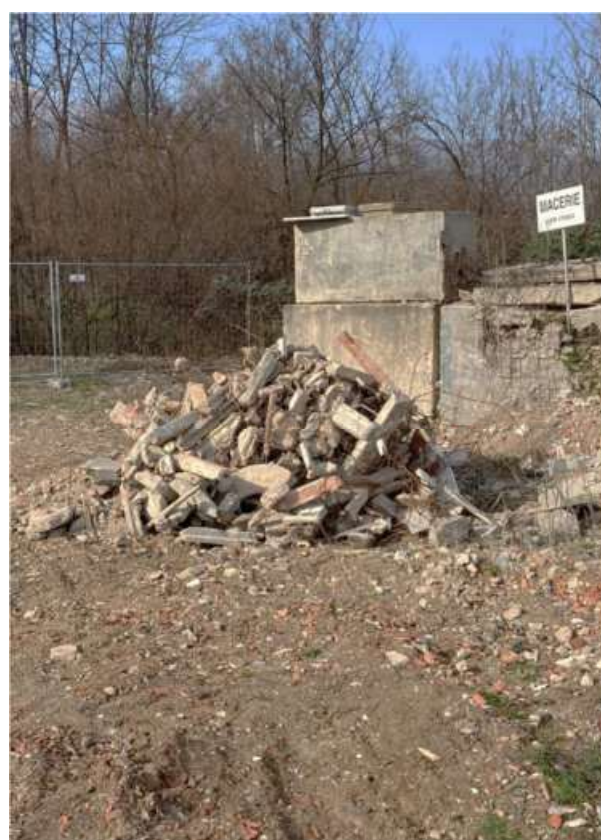
Inerti in fase di campionamento