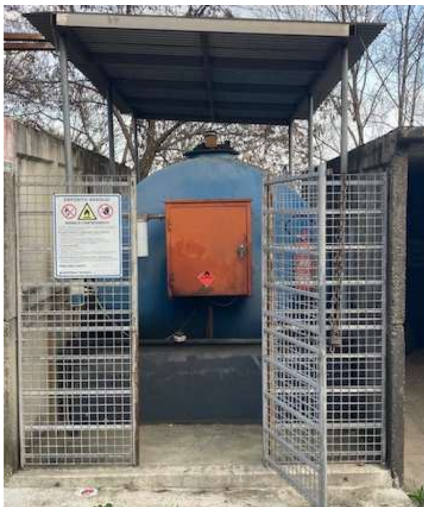
Cisterna BIONDI E GRASSI & C. SRL dotata di bacino di contenimento per stoccaggio CER 160708