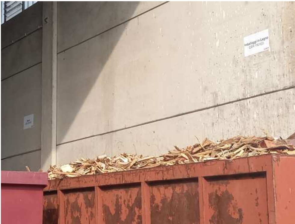
Cartellonistica aree stoccaggio rifiuti