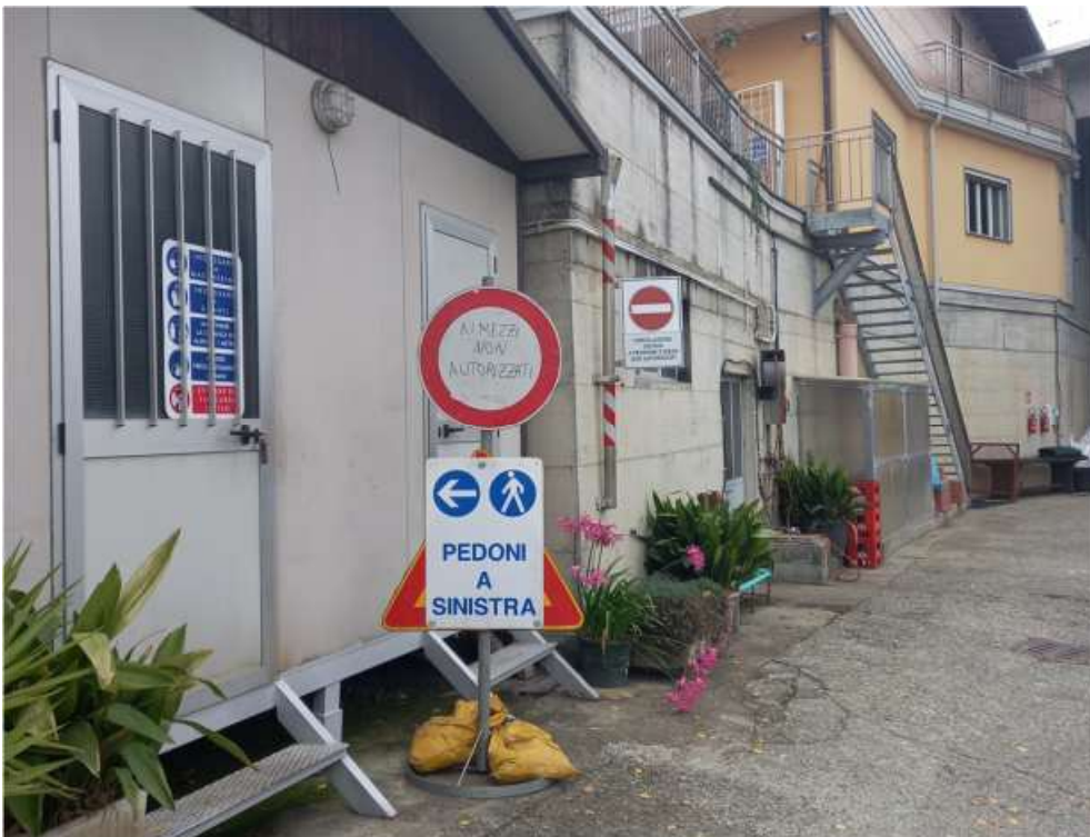
Cartellonistica, indicazioni percorsi, viabilità e divieti