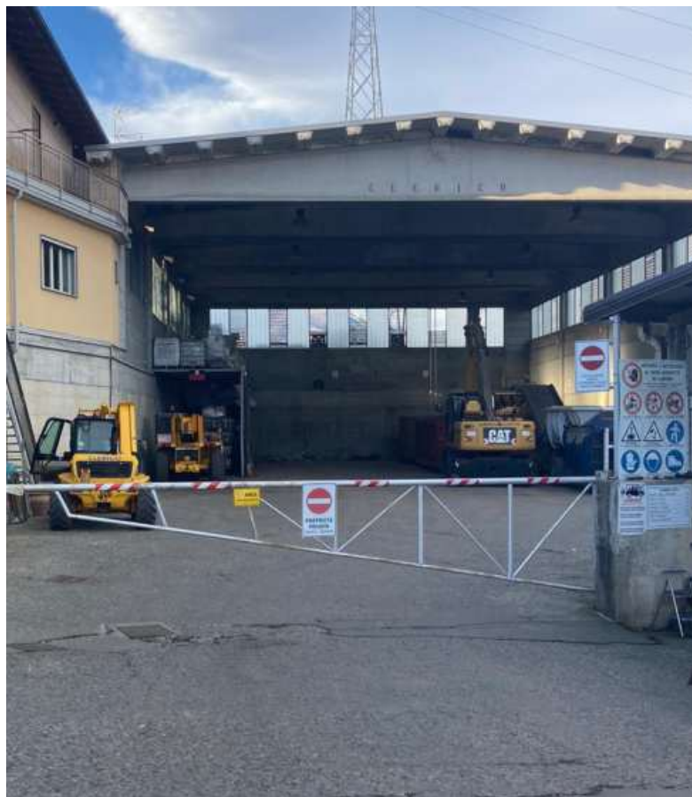
Ingresso al complesso e barra di sollevamento