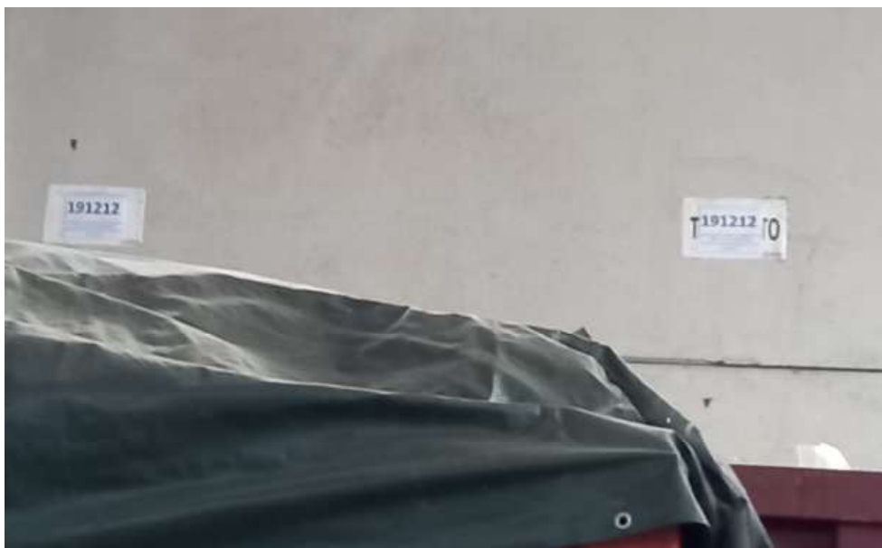
Cartellonistica area stoccaggio rifiuti