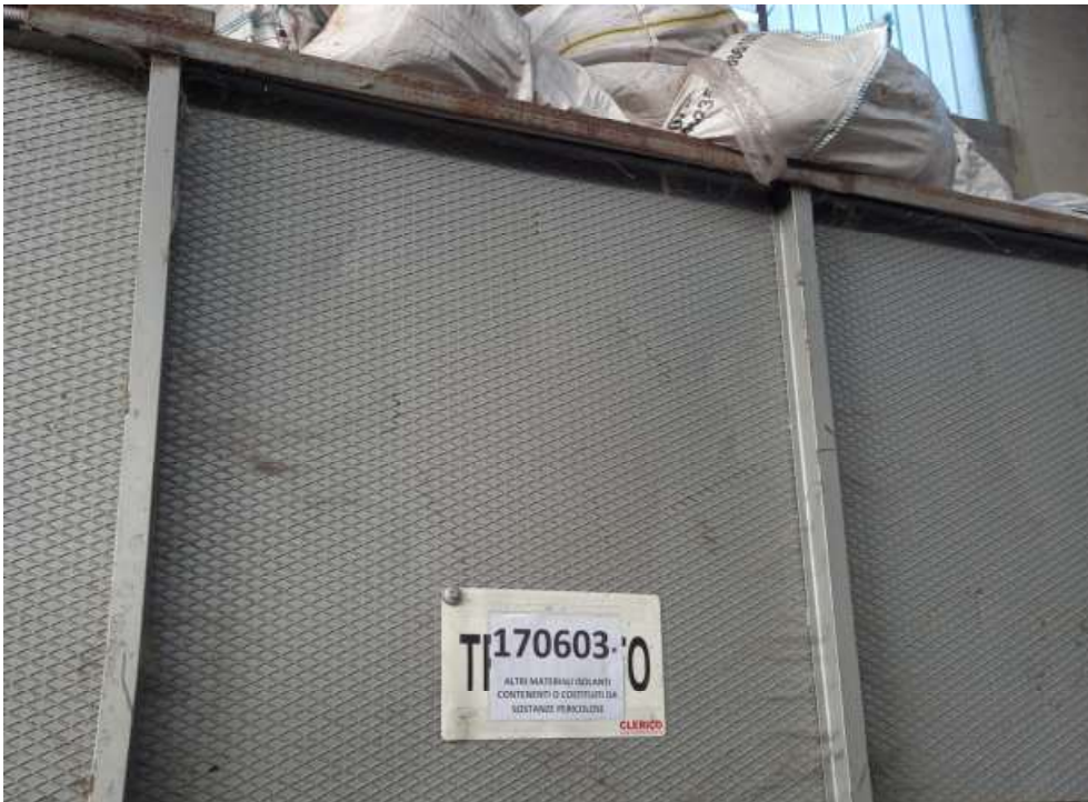
Cartellonistica area stoccaggio rifiuti