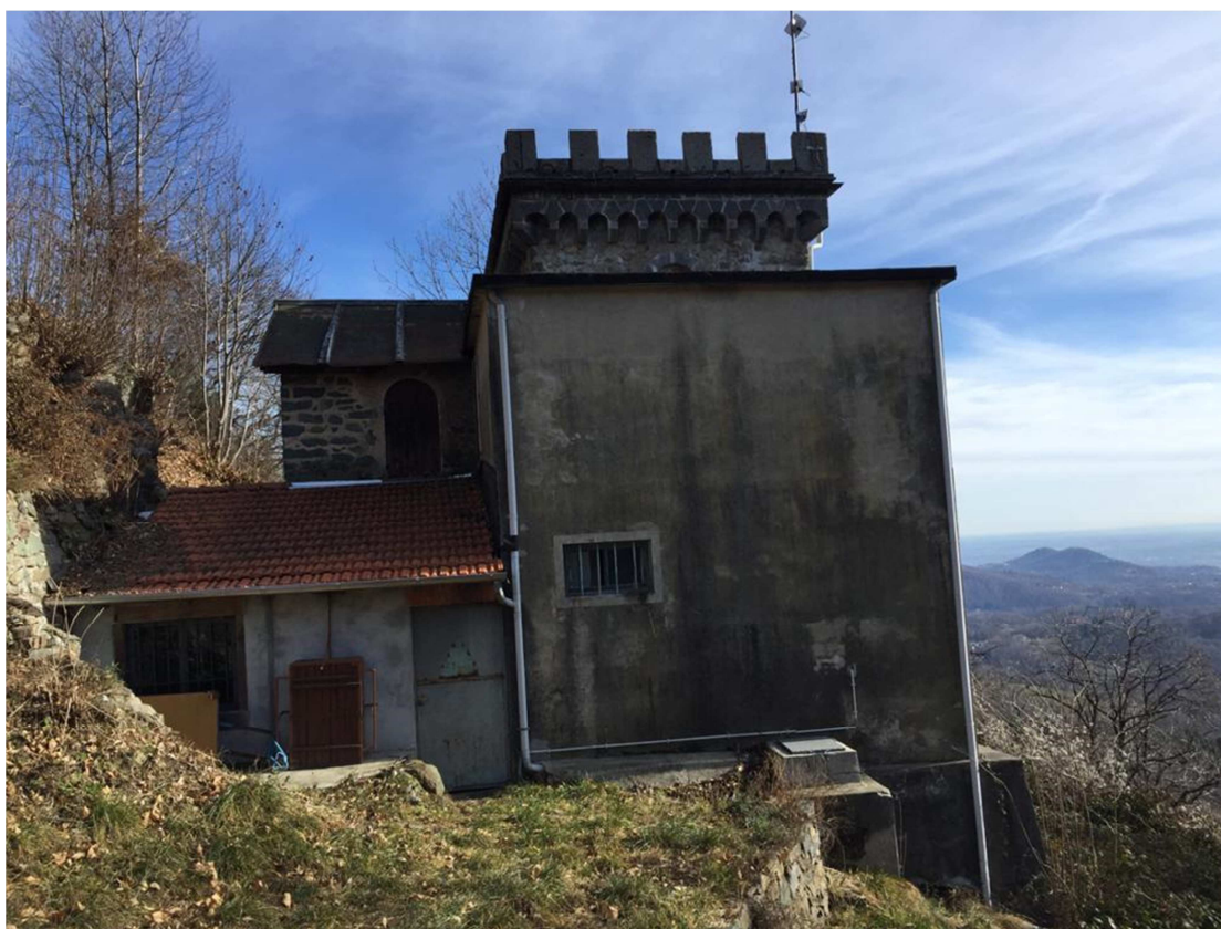
Fig. 6 – Il fabbricato che ospita la vasca di carico dell’impianto dalla quale partono le condotte forzate