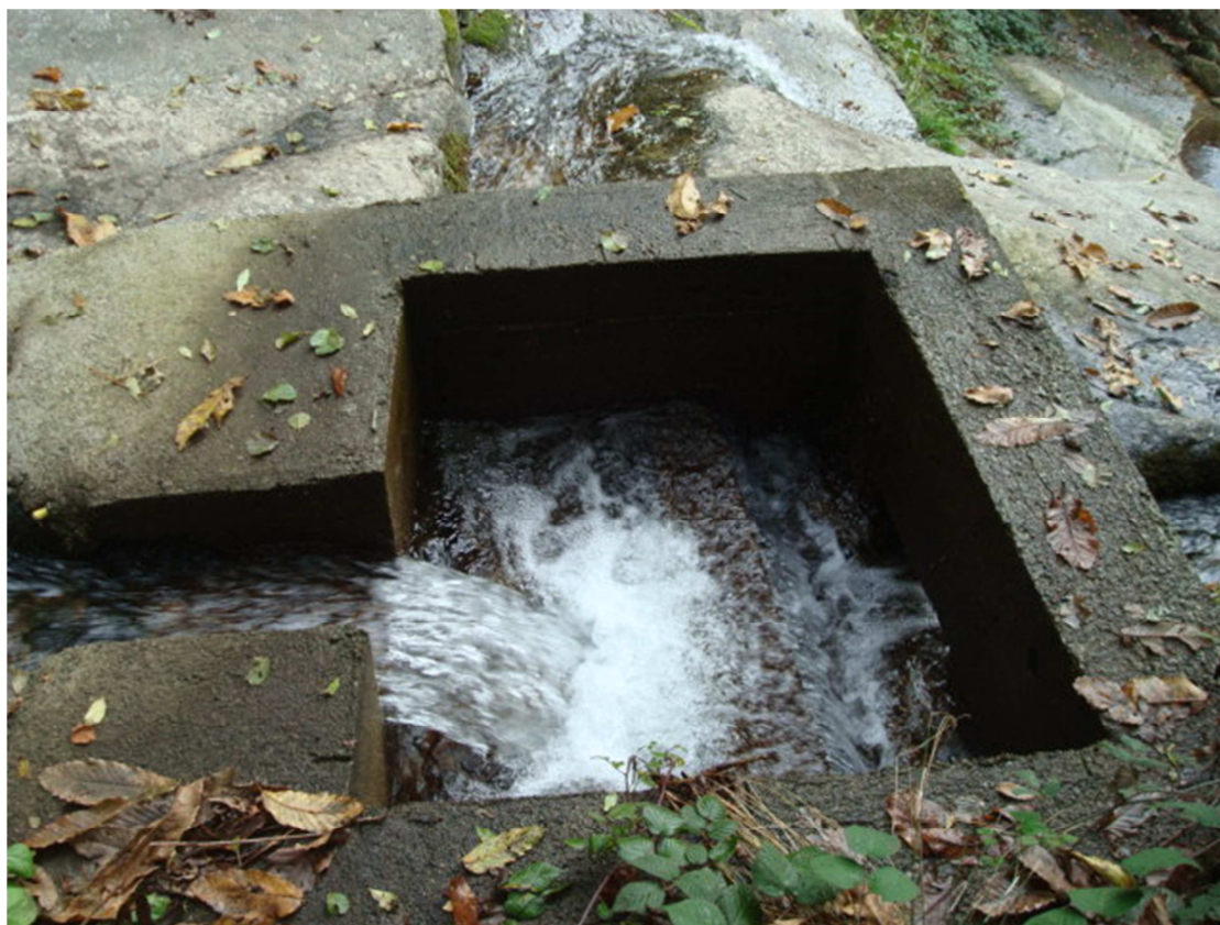
Fig. 2 - Opera di presa sul Rio Grande

prima vasca è stata realizzata l'apertura attraverso la quale viene rilasciato il D.M.V.. Le dimensioni dell'apertura e l'altezza del cordolo divisorio sono state determinate in modo tale che l'acqua possa iniziare a tracimare nel vano di carico vero e proprio solo quando la portata che esce dall'apposita apertura è pari ai 6 l/s che costituiscono il D.M.V. da rilasciare.