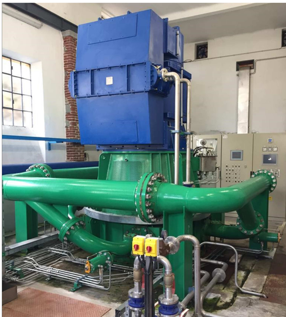
Fig. 10 – Il gruppo di produzione turbina+generatore