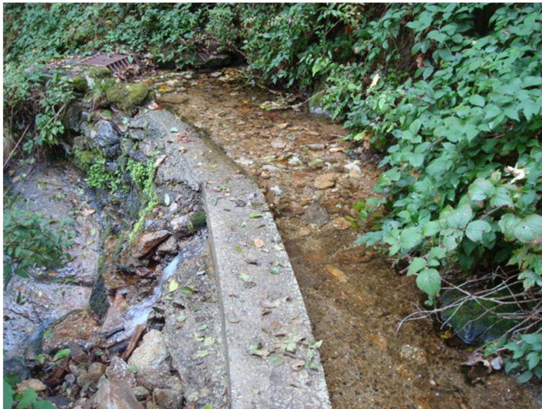
Fig. 3 - Opera di presa sul rio Moscarola

presa vera e propria solo quando la portata che esce dal foro è pari ai 3 l/s che costituiscono il D.M.V..