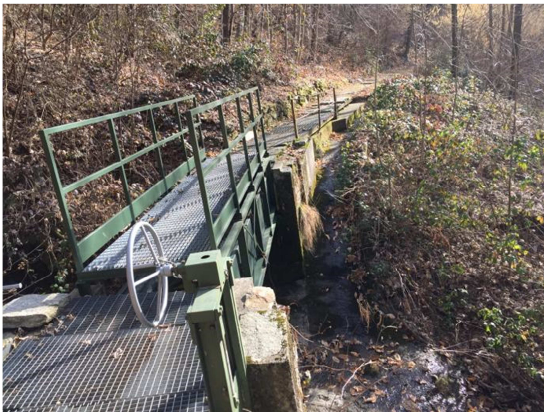
Fig. 5 – Ponte canale sul rio Neggia. Nel tratto a valle si vede lo sfioratore laterale con il canale di scarico nel rio dell'acqua che tracima

Si è comunque deciso di mantenere in funzione la griglia e lo sgrigliatore in quanto questi materiali potrebbero comunque entrare nel canale tramite le opere di presa secondarie o attraverso le griglie che coprono i ponti-canale.