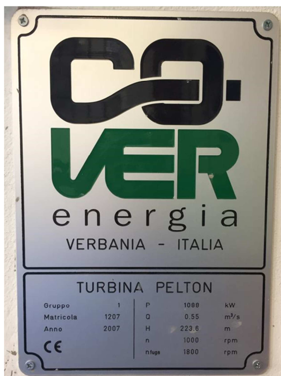
Fig. 8 – La targa della turbina Pelton

Come mostrano le fotografie delle targhe della turbina e del generatore riportate nel seguito, la prima è stata costruita per una portata massima di 550 l/s ed ha una potenza di targa di 1088 kW.