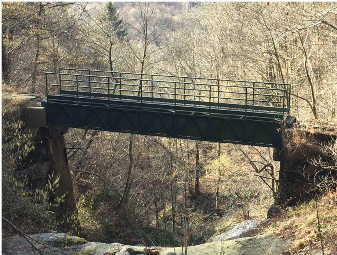
Fig. 4 – Ponte canale per l'attraversamento del rio Grande

no interamente in acciaio e la sezione in cui scorre l'acqua è coperta da un grigliato in acciaio zincato che permette di camminarci sopra.