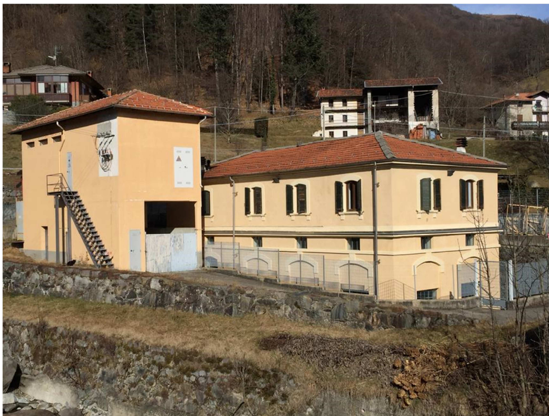
Fig. 7 – L'edificio che ospita la centrale (al piano interrato) e l'alloggio del custode al piano terra. A fianco, la cabina di consegna ENEL posta al primo piano

Come mostrano le fotografie delle targhe della turbina e del generatore riportate nel seguito, la prima è stata costruita per una portata massima di 550 l/s ed ha una potenza di targa di 1088 kW.