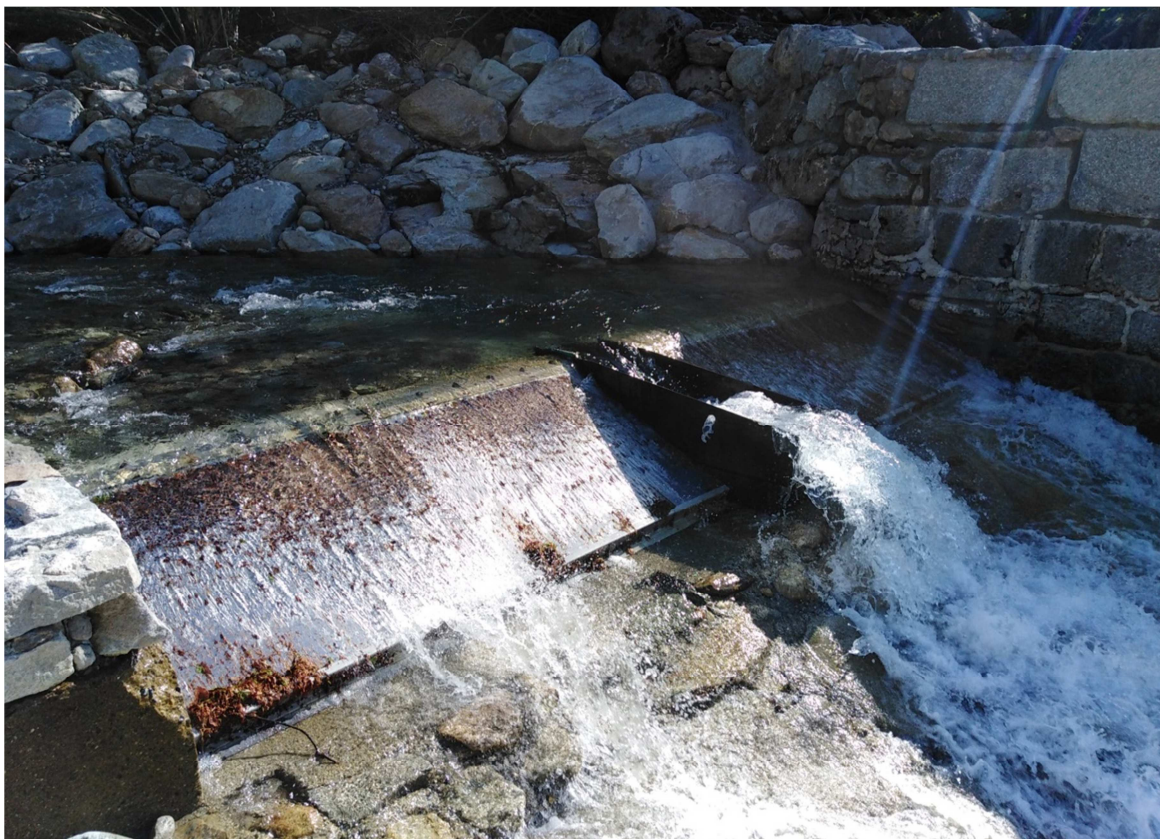
Fig. 1 – L'opera di presa sul torrente Oropa a seguito degli interventi di ripristino successivi agli eventi alluvionali dell'ottobre 2020. Al centro il dispositivo per il rilascio del DMV

realizzazione della presa a trappola con griglia Coanda questo problema è stato risolto quasi completamente in quanto le fessure della griglia sono talmente sottili da far passare solo le particelle più fini del materiale trasportato dall'acqua.