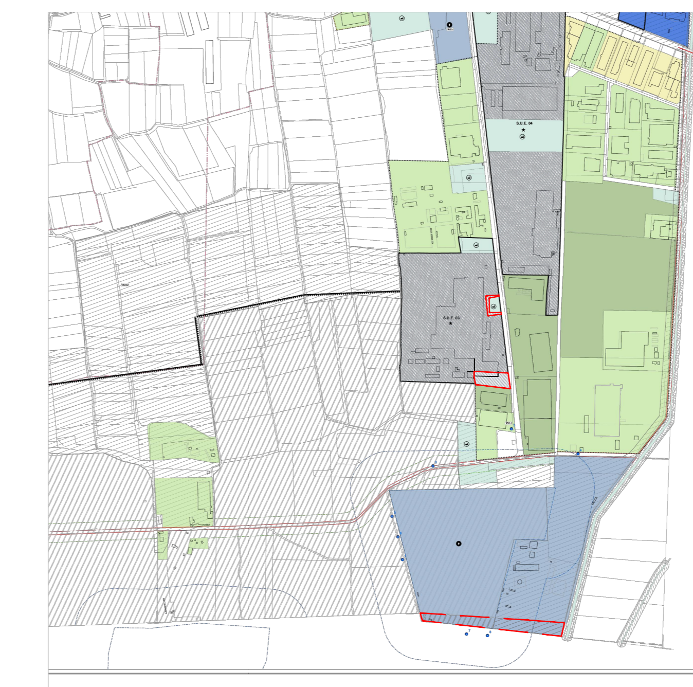
PRGc Adottato - Proposta di variante Scala 1:10000