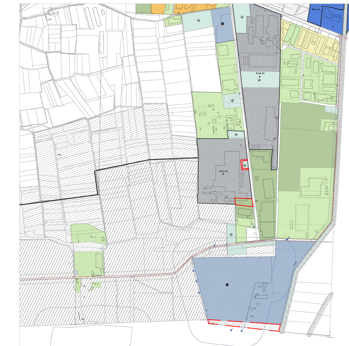
PRGc Adottato Scala 1:10000