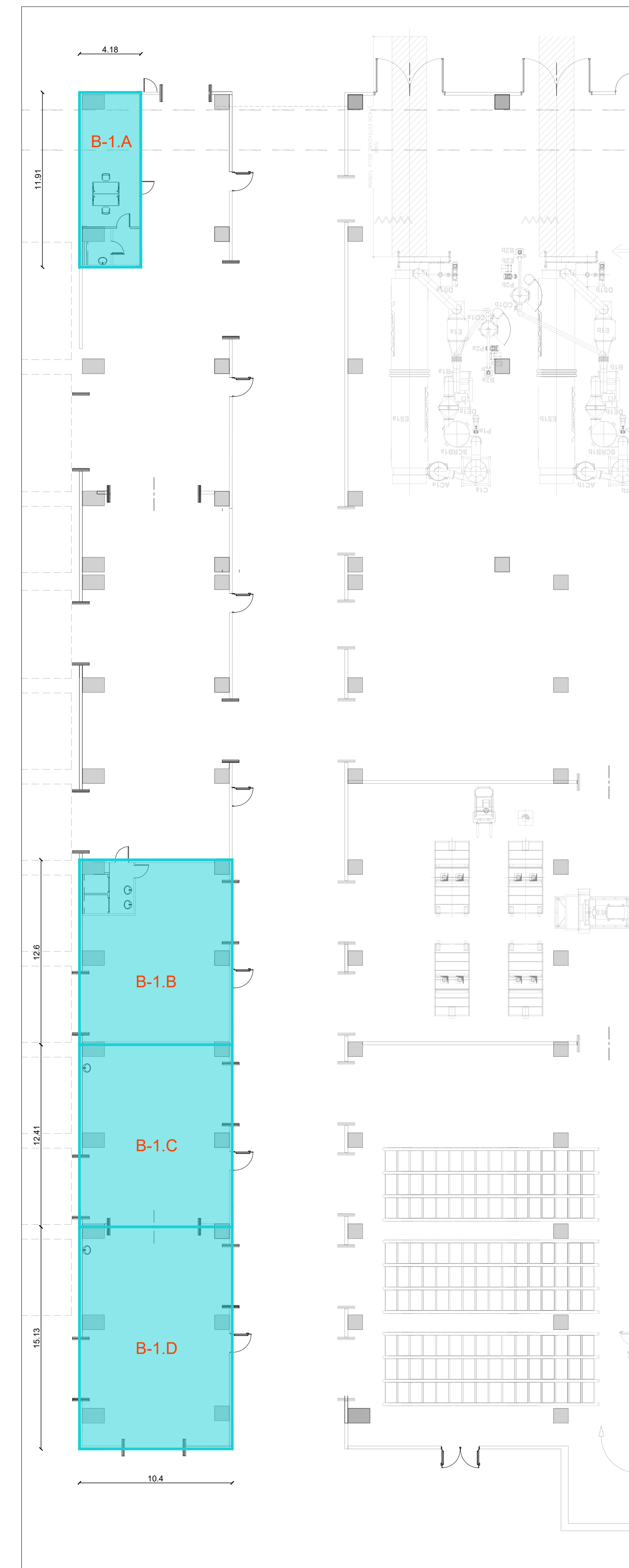
Pianta Quota -10.50m Scala 1:200 Superficie Lorda