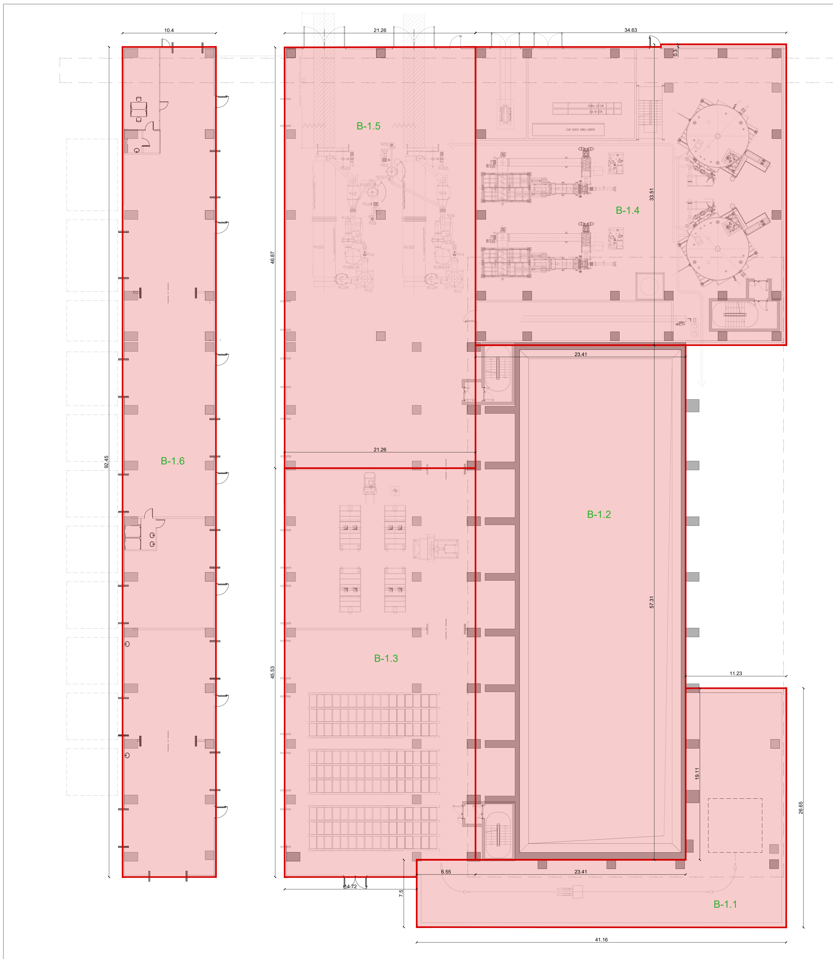
Pianta Quota -10.50m Scala 1:200 Superficie Totale

È vietato consegnare a terzi o riprodurre questo documento, utilizzare il contenuto o renderlo comunque noto a terzi senza autorizzazione. Ogni infrazione comporta il pagamento dei danni sociali. Sono riservati tutti i diritti derivanti dalla concessione di brevetti per invenzioni, di modelli industriali di utilità e di disegni o modelli. The reproduction, distribution and utilization of this document as well as the communication of its contents to others without express authorization is prohibited. Offenders will be held liable for the payment of damages. All rights reserved in the event of the grant of patent, utility models or design.