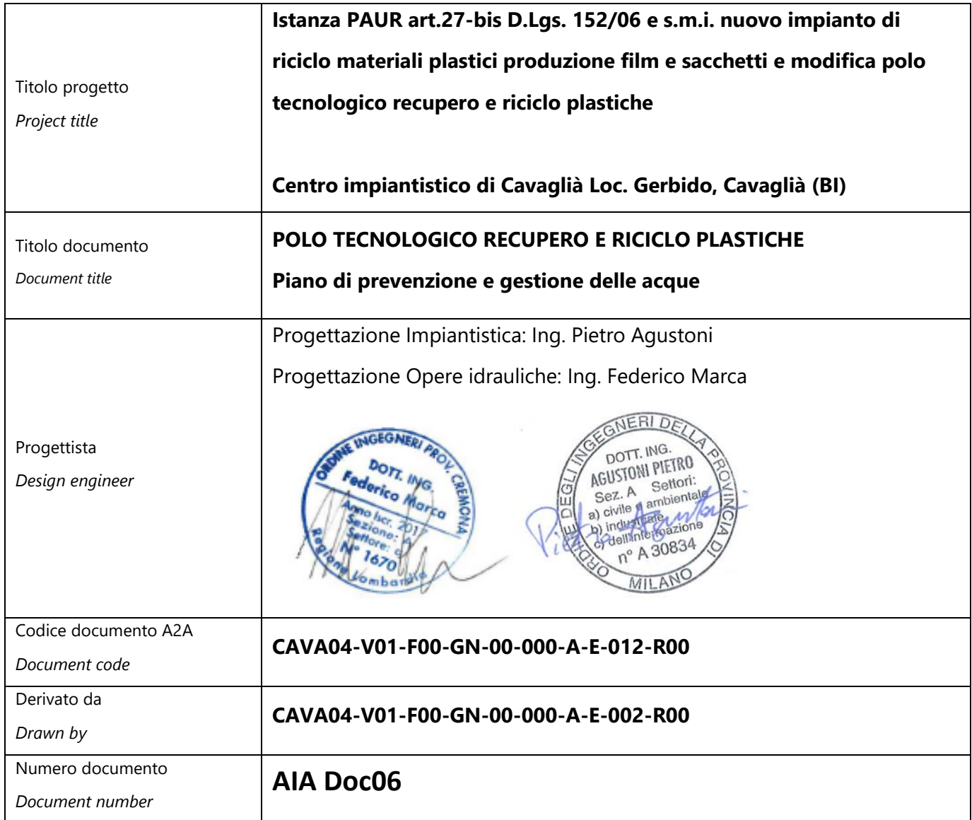
Tabella delle revisioni