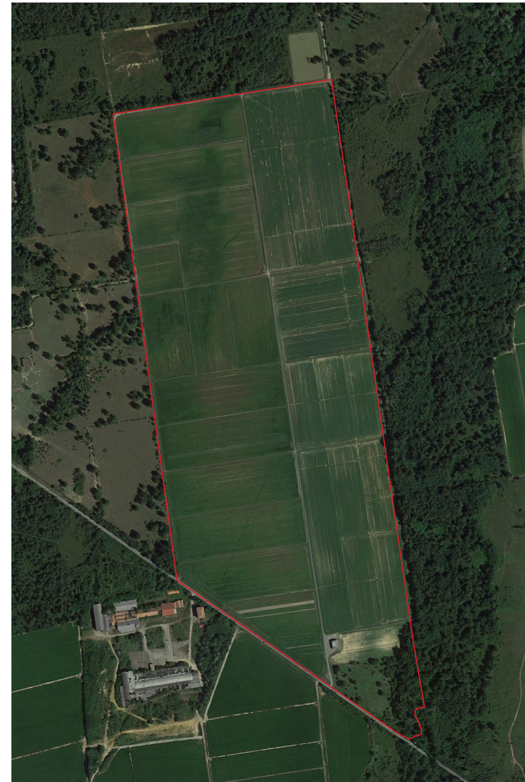
Ortofoto scala 1:5000