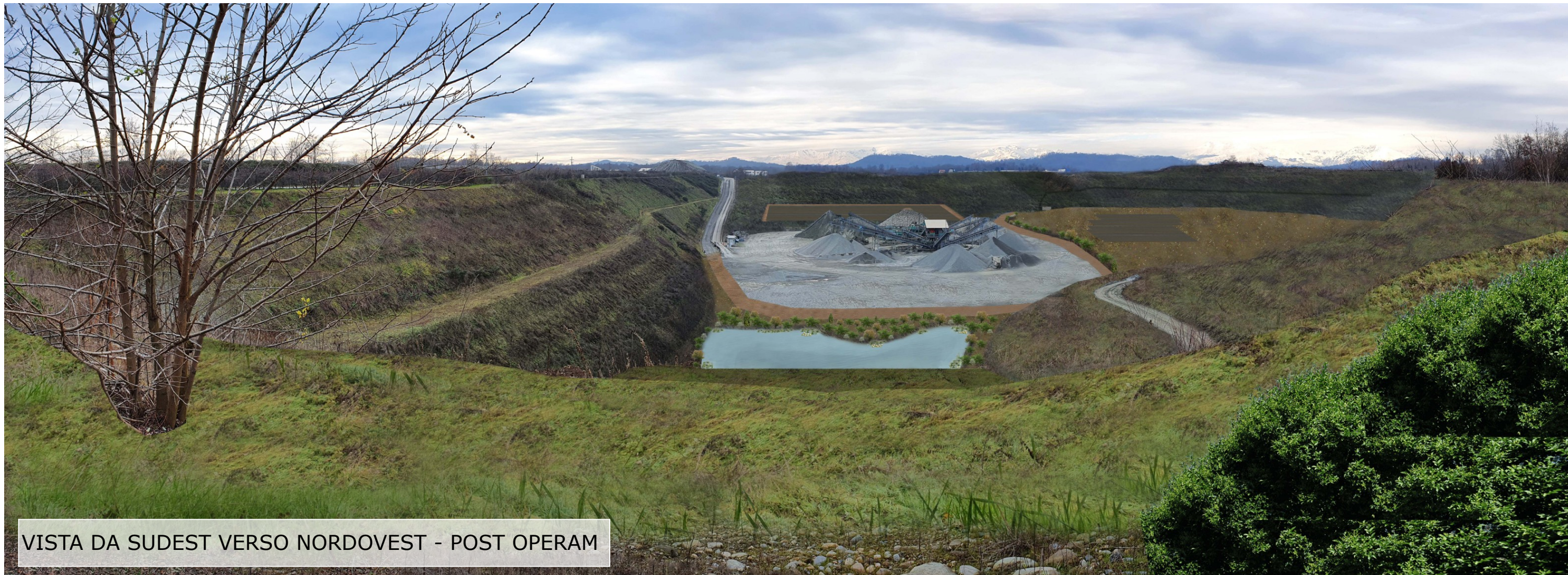
VISTA DA SUDEST VERSO NORDOVEST - POST OPERAM