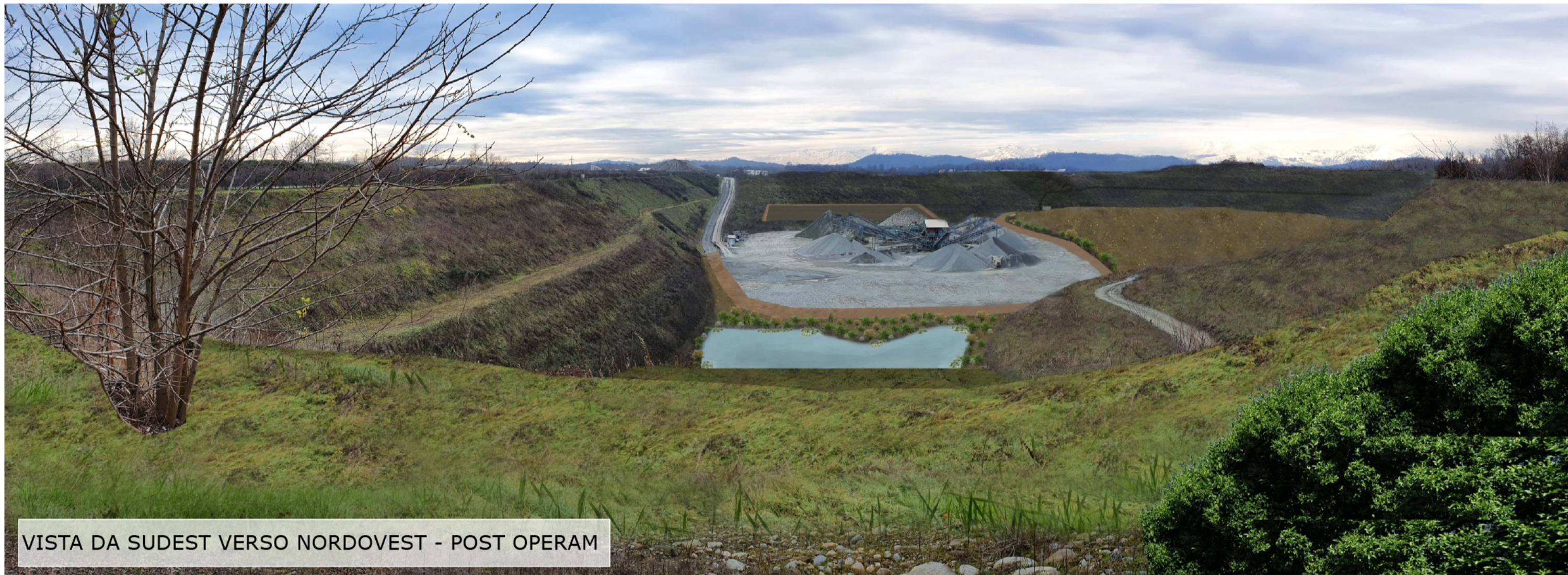
VISTA DA SUDEST VERSO NORDOVEST - POST OPERAM