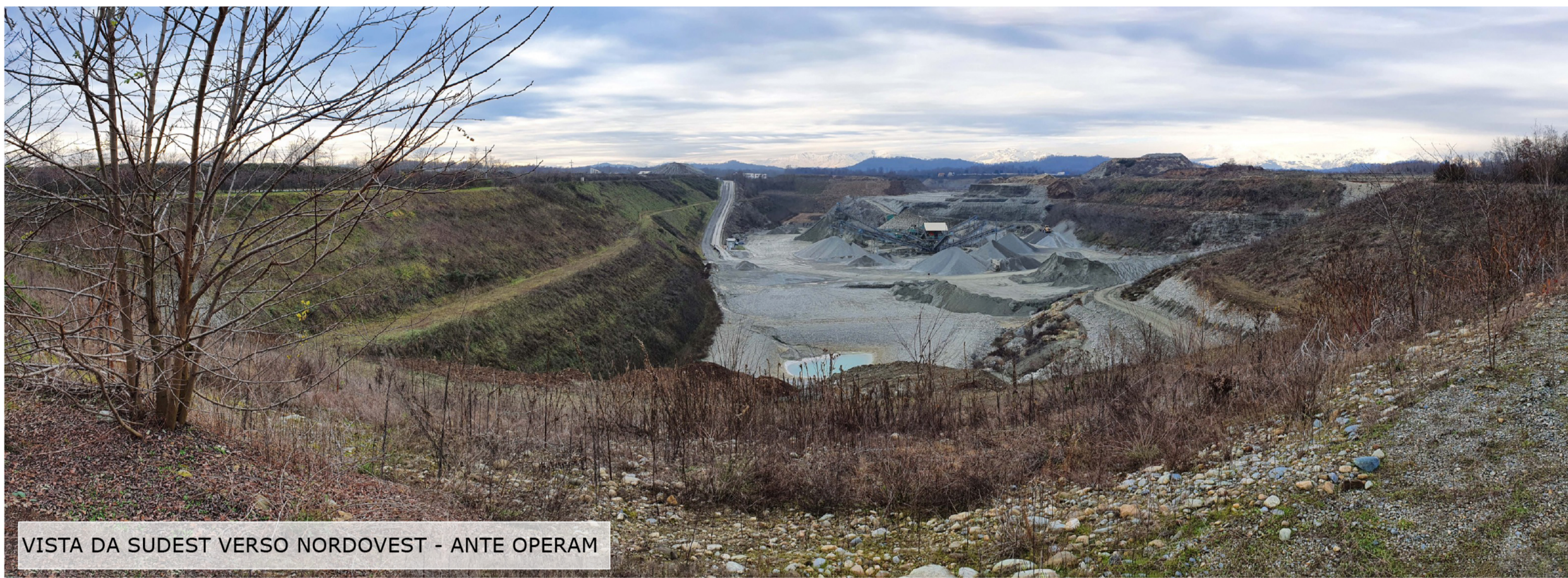
VISTA DA SUDEST VERSO NORDOVEST - ANTE OPERAM