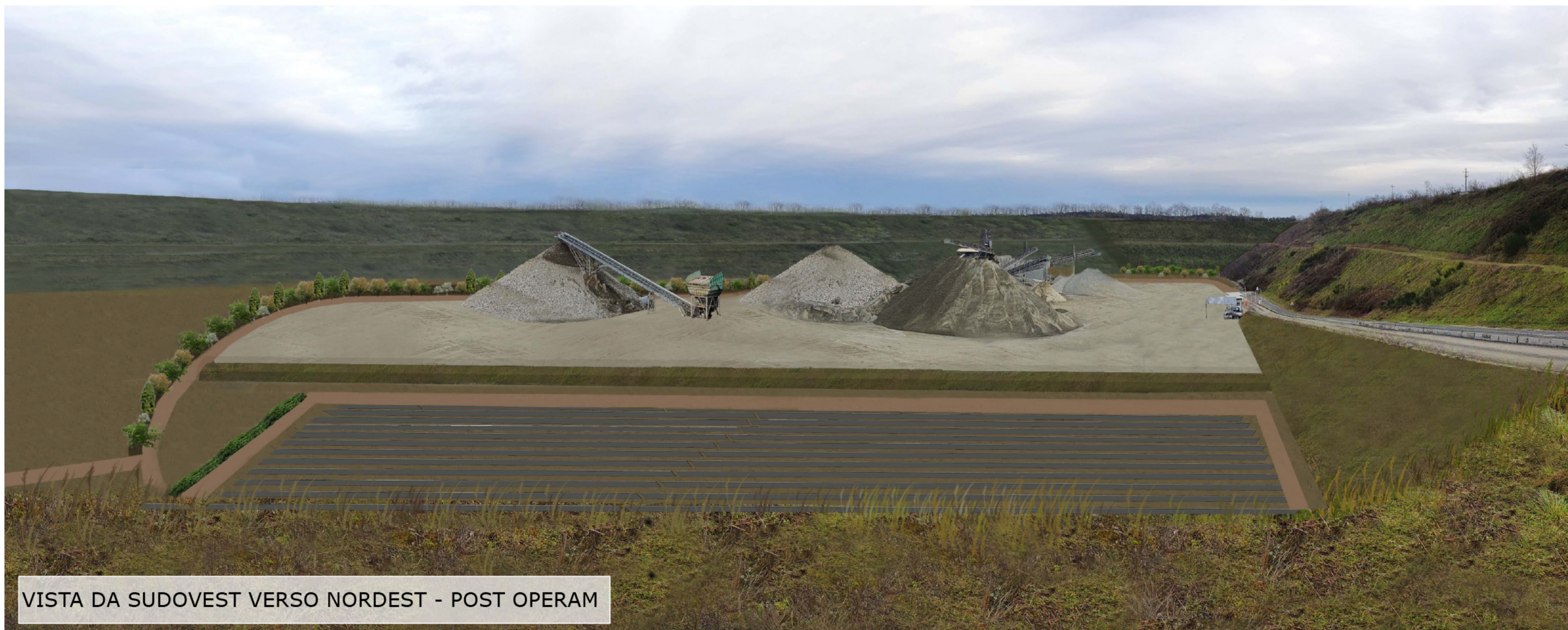
VISTA DA SUDOVEST VERSO NORDEST - POST OPERAM