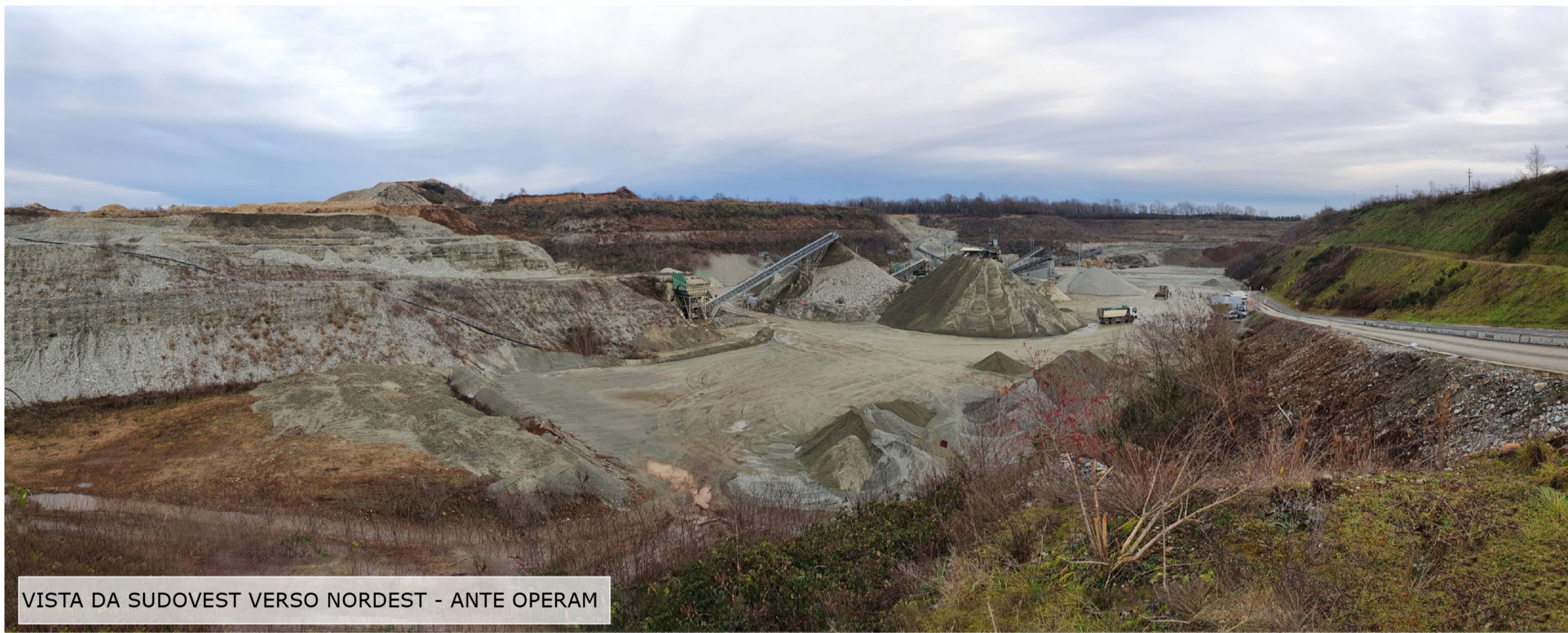
VISTA DA SUDOVEST VERSO NORDEST - ANTE OPERAM