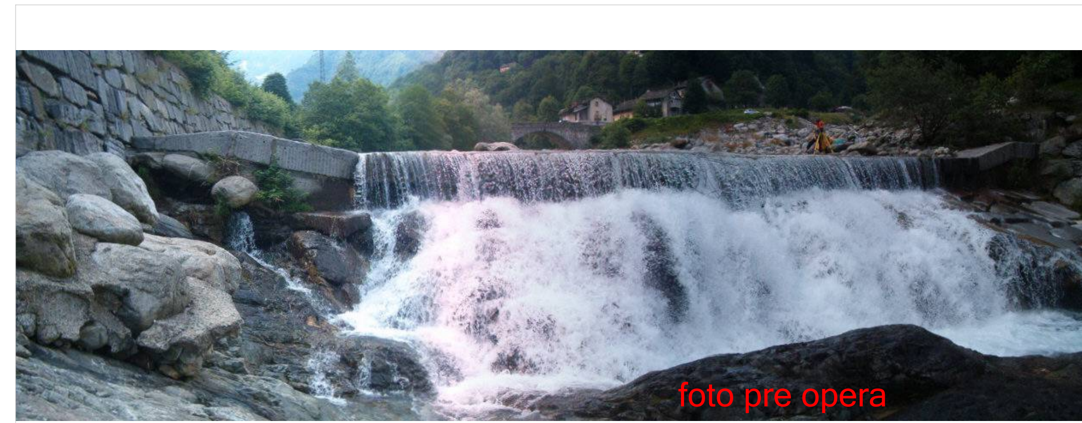
foto pre opera

N.B. SIPEA S.R.L. SI RENDE DISPONIBILE A CONSOLIDARE CON MASSI CEMENTATI IL MURO IN SINISTRA DELLA SCALA VERSO CENTRO ALVEO ED EVENTUALMENTE A RICOSTRUIRE CON MASSI CEMENTATI LA PORZIONE DI BRIGLIA DEMOLITA DALLE PIENE