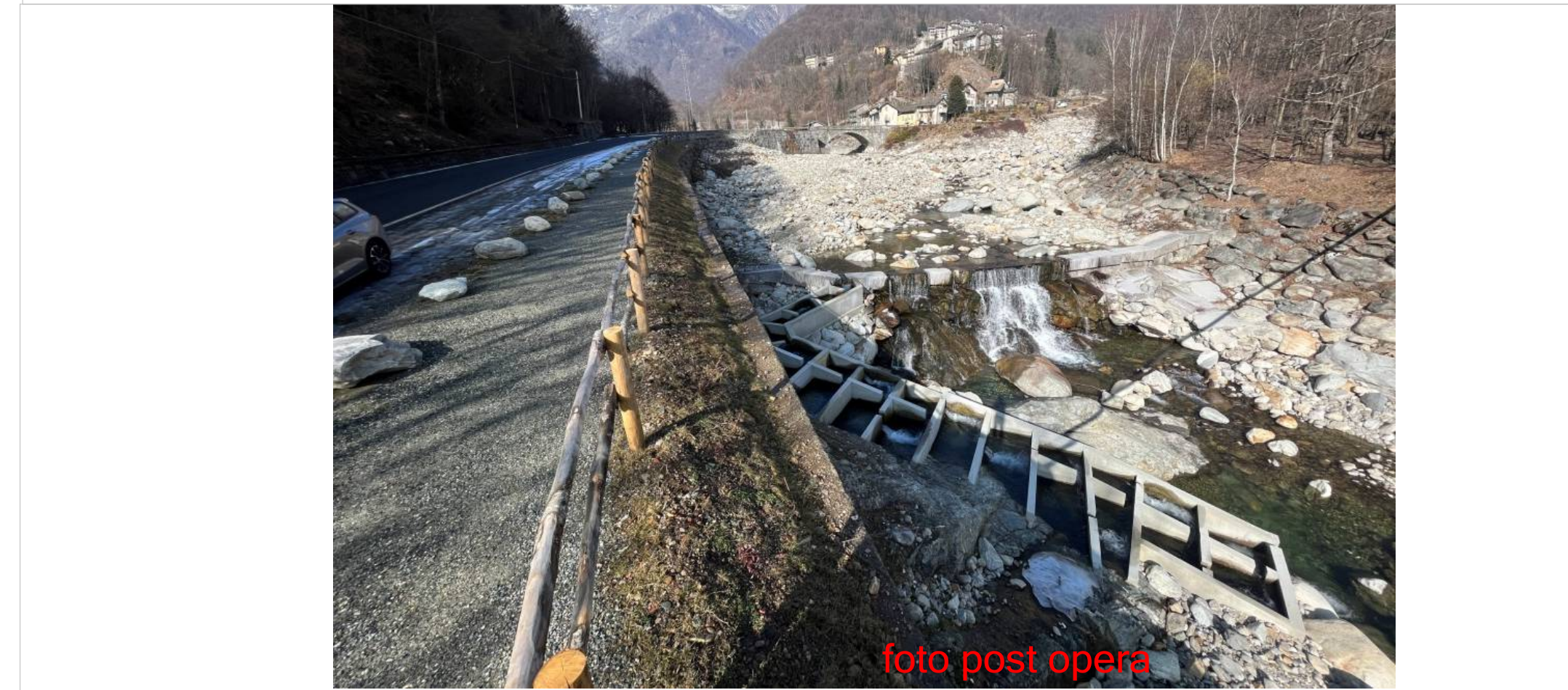
foto post opera