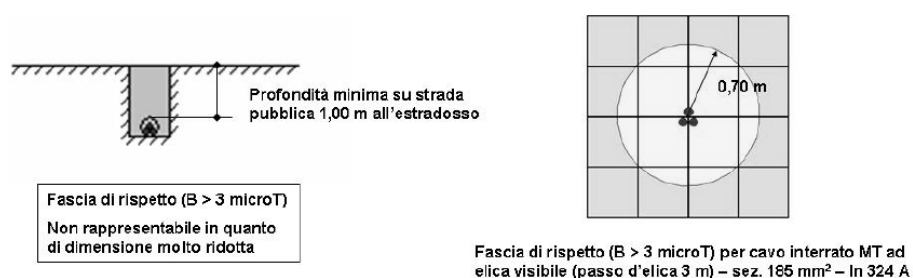
Figura 3 – Curve di livello dell’induzione magnetica generata da cavi cordati ad elica interrati. Calcoli effettuati con il modello tridimensionale “Elicord” della piattaforma “EMF Tools”, che tiene conto del passo d’elica (tratto dalla pubblicazione ENEL “linea Guida per l’applicazione del paragrafo 5.1.3 dell’Allegato al DM 29.05.2008”).

Ai fini della valutazione dell’induzione magnetica prodotta dalla linea in questione valga comunque l’indicazione contenuta nella figura 3 di seguito proposta, tratta dalla “Linea Guida ENEL”: il semplice interrimento del cavo da luogo ad una attenuazione tale da garantire al suolo un valore di induzione compatibile con l’obiettivo di qualità previsto dalla Legge (3µT).