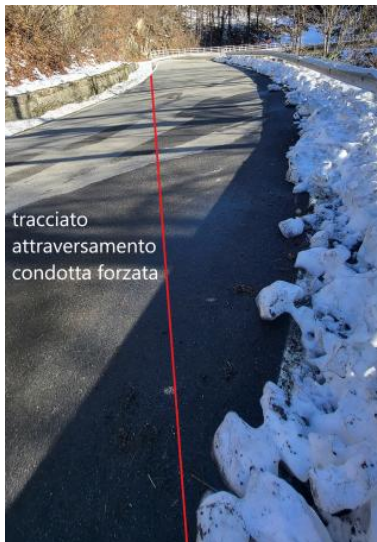
Figura 1: Tracciato attraversamento SP115

l'attraversamento non risulta essere stato realizzato in direzione normale all'asse stradale ma è stato effettuato attraversamento diagonale. Nonostante questo, non sono stati rilevati né segnalati problemi particolari con la viabilità durante l'esecuzione dei lavori.