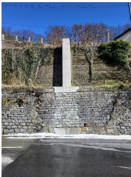
Figura 2: Tratto di condotta mascherato dal muro ripristinato

Come mostrato nella Figura 2 il muro di sostegno inglobante la condotta è stato realizzato in continuità rispetto l'esistente, il tratto superiore invece non è stato rivestito con pietrame locale per mantenere la medesima tipologia di materiale con cui è a contatto.