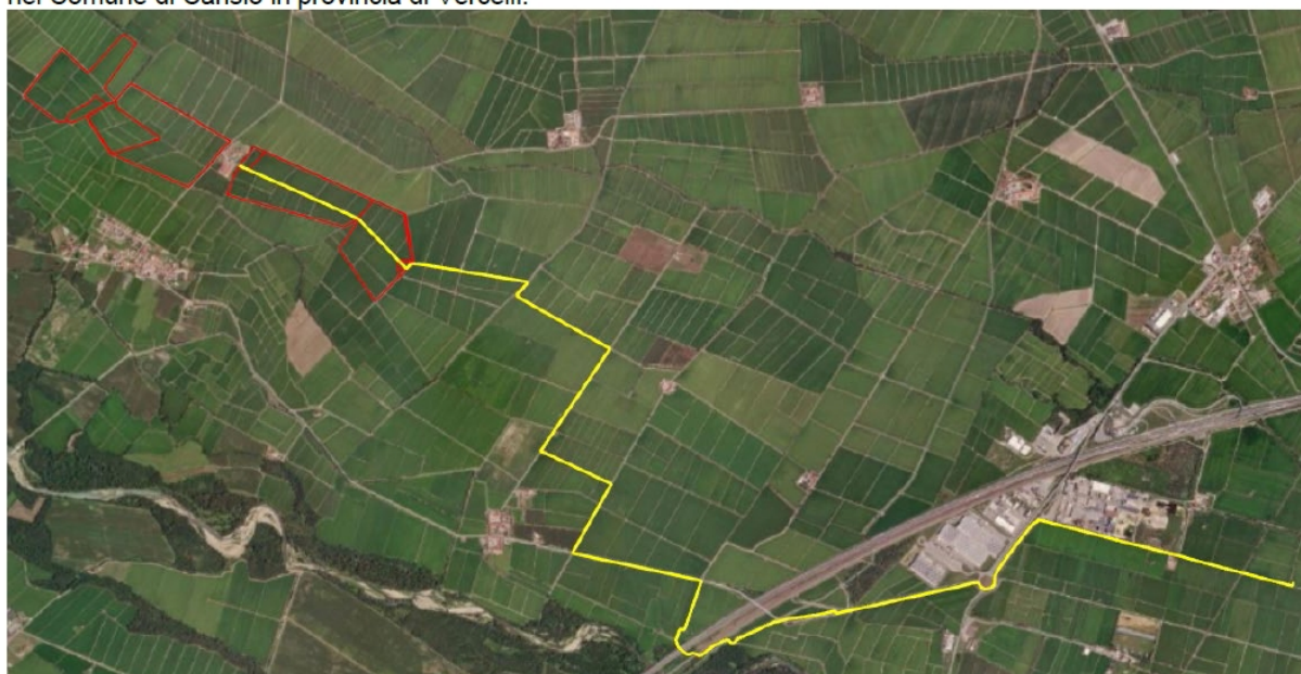
Figura 14 - Inquadramento su Ortofoto dell'area di impianto (in rosso) e del cavidotto in AT (in giallo)

L'energia prodotta dal campo fotovoltaico verrà veicolata mediante un cavidotto interrato in alta tensione a 36 kV lungo circa 9,46 km fino alla sottostazione Terna in prossimità dell'area industriale "La Baraggia" sita nel Comune di Carisio in provincia di Vercelli.