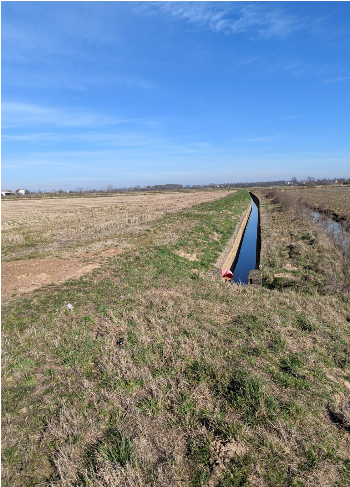
Foto 5 – Miglioramento fondiario “Montino”: dettaglio del canale adacquatore a nord della piana 5M (non interessato dai lavori).