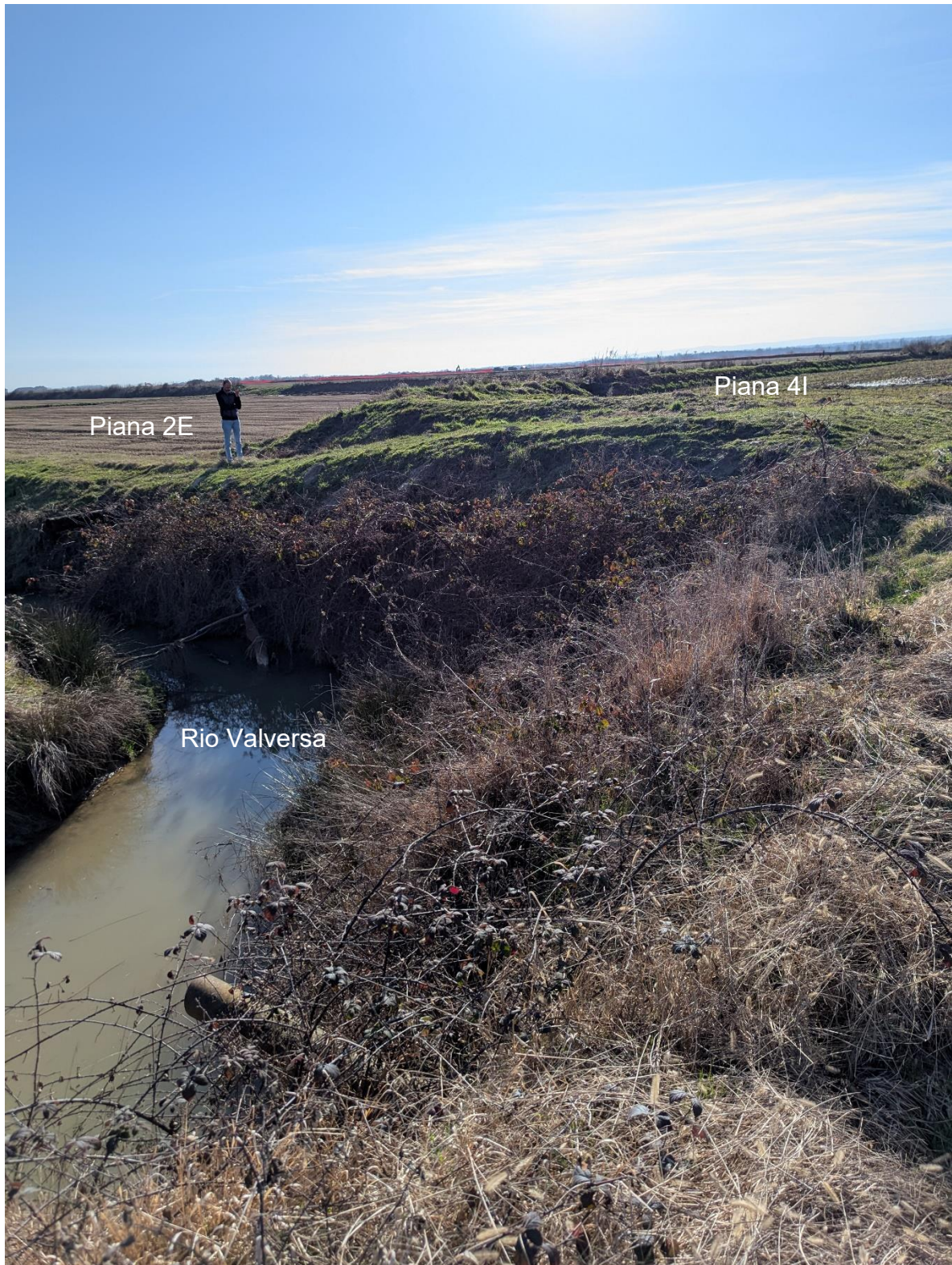
Foto 6 – Miglioramento fondiario “Montino”: dettaglio del Rio Valversa tra le piane 4I e 2E.