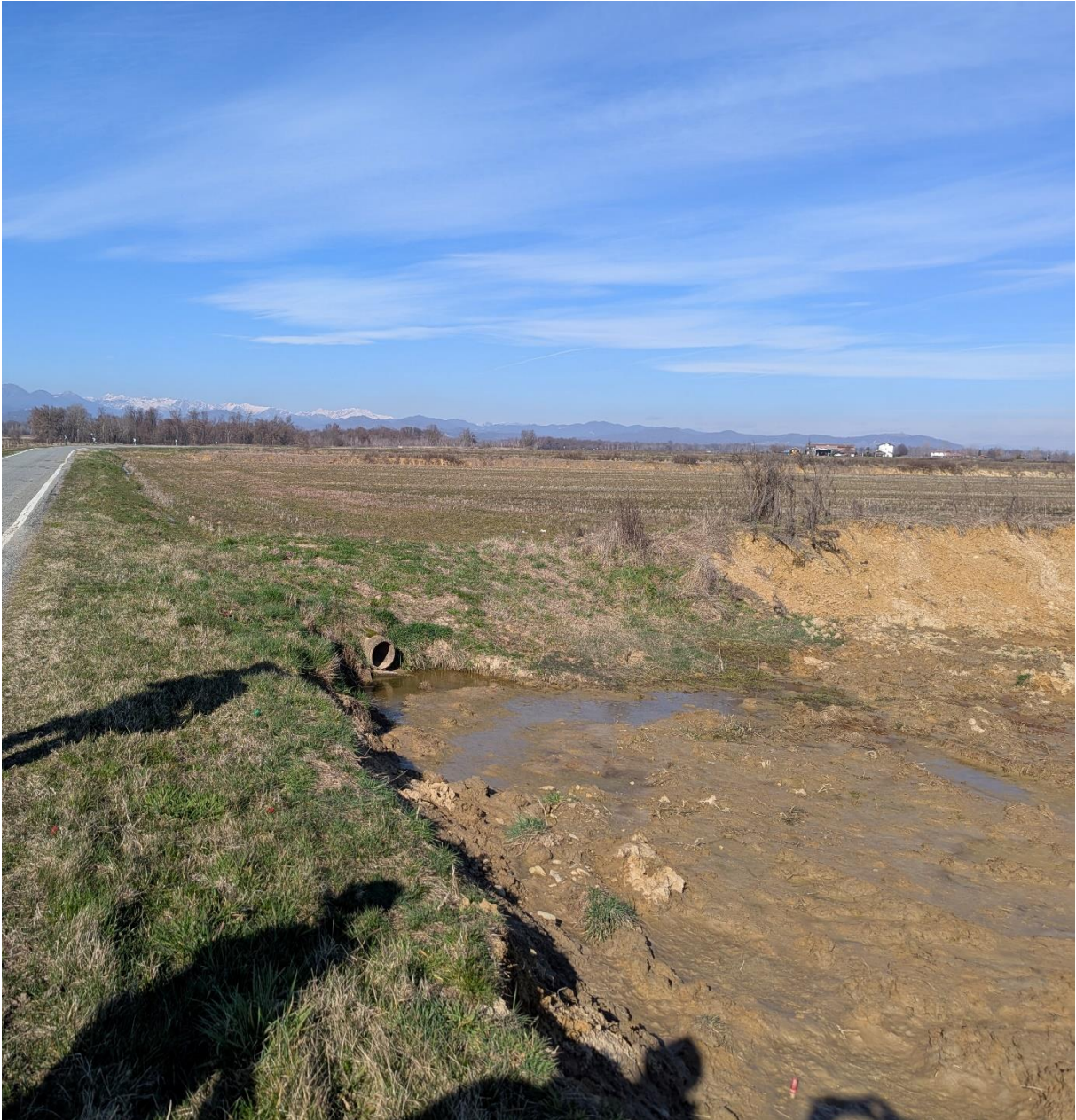
Foto 4 – Miglioramento fondiario “Montino”: dettaglio della bocchetta adacquatrice tra la piana 4I (a monte) e la piana 3G (a valle).