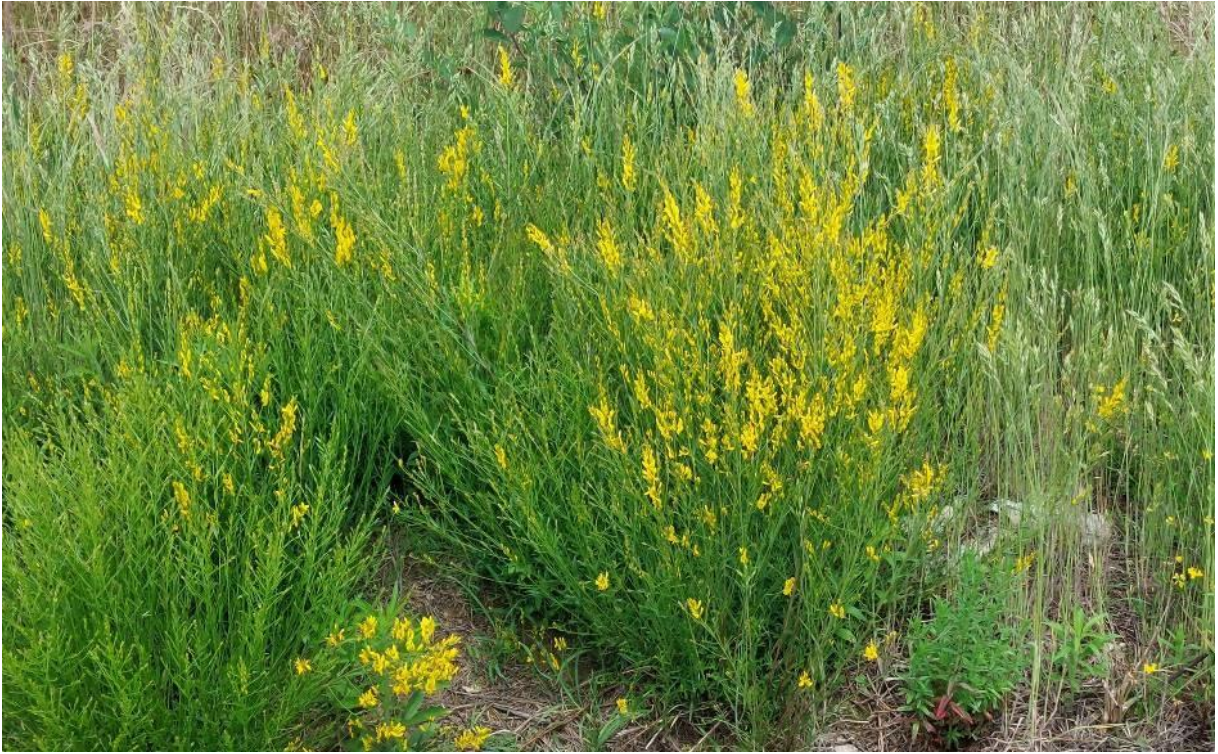
Foto 12 – Adiacente miglioramento fondiario "Sette Sorelle": Genista tinctoria lungo le scarpate di neoformazione