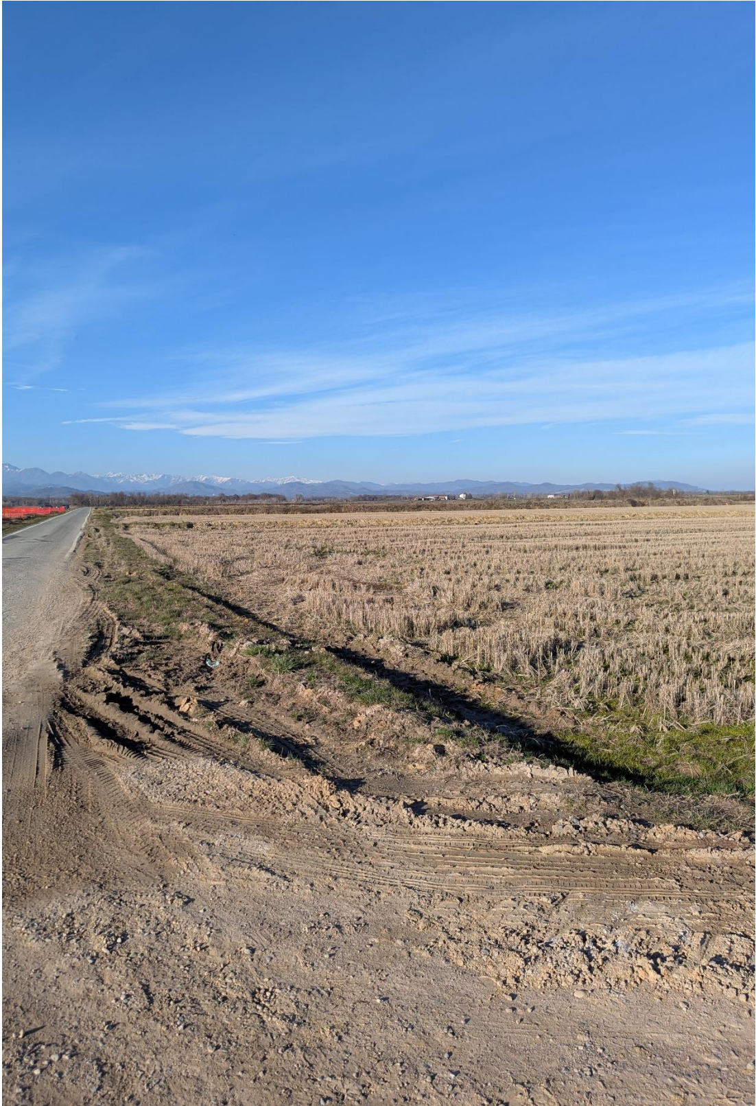
Foto 9 – Miglioramento fondiario “Montino”: panoramica della piana 1B (sullo sfondo la piana 1CI). A sinistra la SP 316 “Buronzina” (direzione nord).