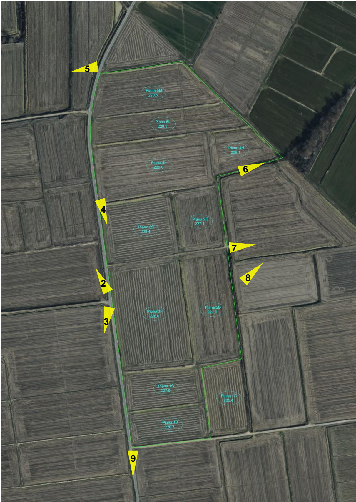
Figura 1 – Ortofoto (Bing) con individuazione delle piane allo “stato attuale”. In verde l’area interessata dal progetto di miglioramento fondiario “Montino”; in giallo i coni di visuale della documentazione fotografica.