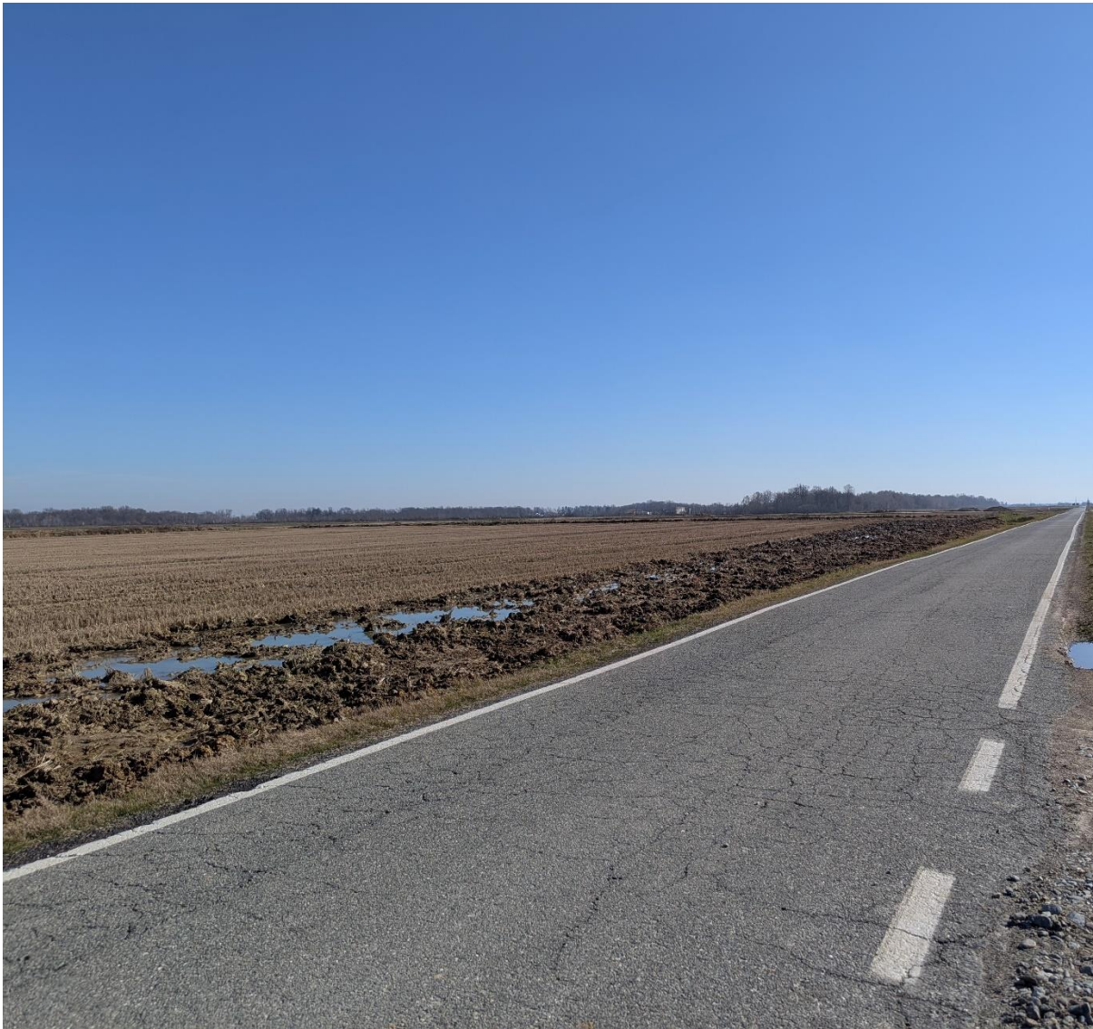
Foto 2 – Miglioramento fondiario “Montino”: panoramica della piana 3F (sullo sfondo le piane 1C e 1B). In prima piano la SP 316 Buronzina” (direzione sud).