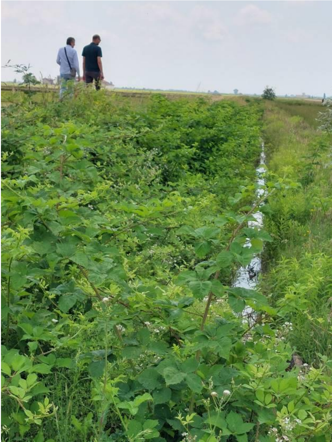
Foto 10 – Adiacente miglioramento fondiario "Sette Sorelle" : colonizzazione di Rubus sp. lungo un fosso di scolo.