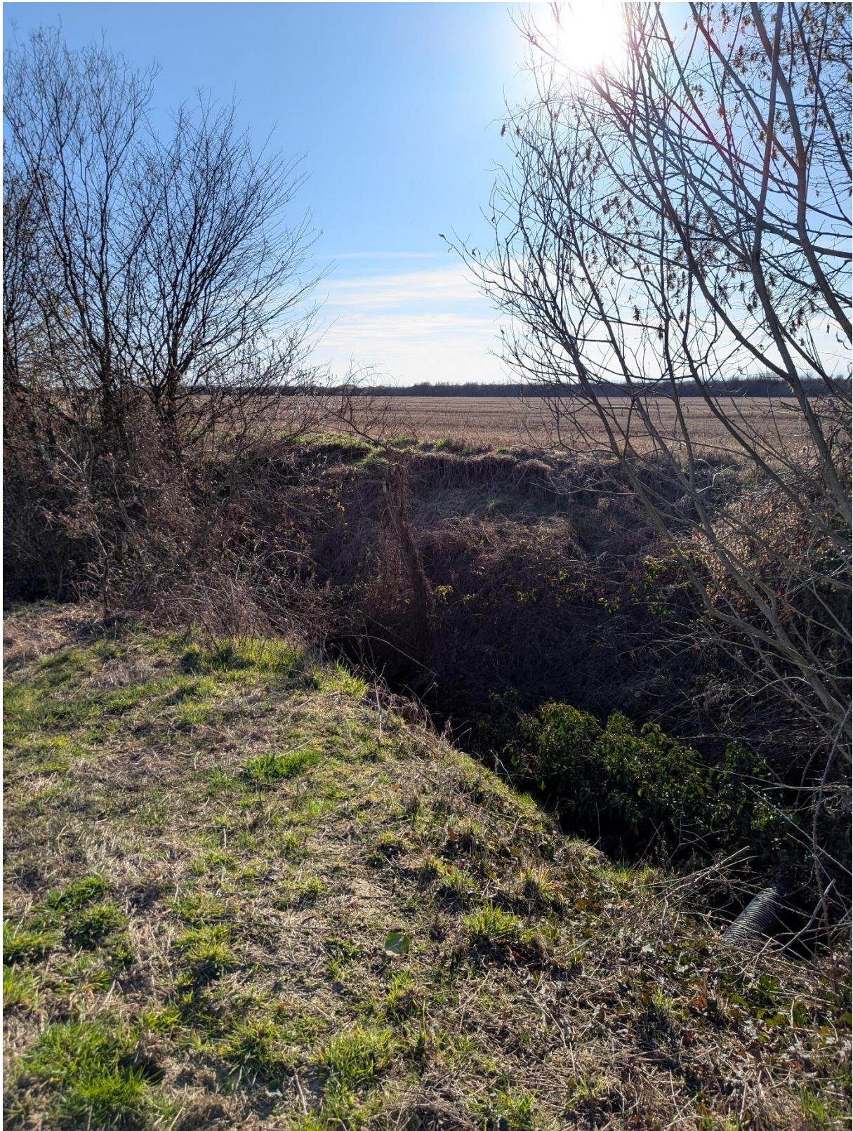
Foto 8 – Miglioramento fondiario “Montino”: panorama dall’esterno dell’area di intervento verso la piana 2D con in primo piano un dettaglio del Rio Valversa.