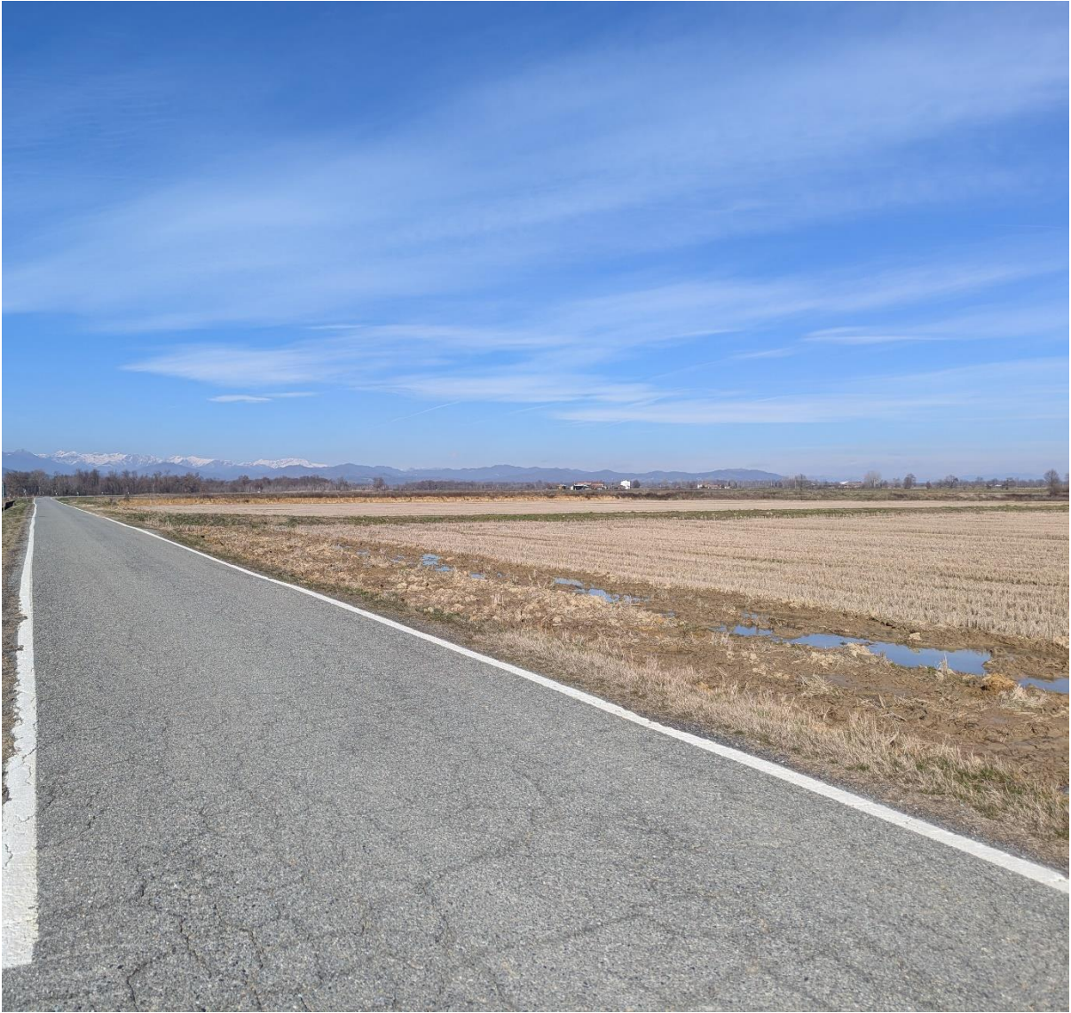
Foto 3 – Miglioramento fondiario “Montino”: panoramica della piana 3F (sullo sfondo le piane 3G e 4I). In prima piano la SP 316 Buronzina” (direzione nord).