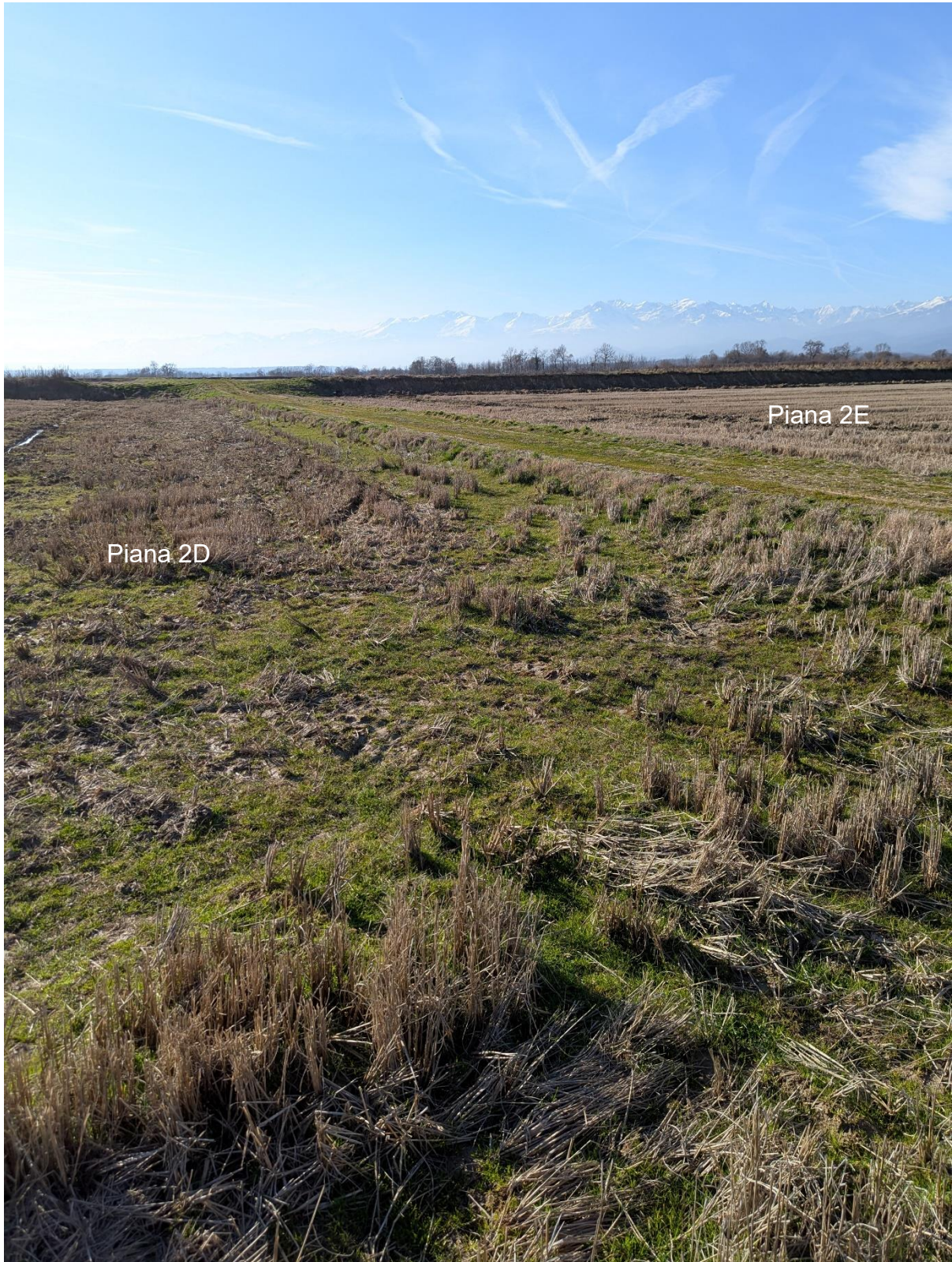
Foto 7 – Miglioramento fondiario “Montino”: panorama delle piane 2E e 2D. Sullo sfondo la scarpata che separa la piana 2E dalla piana 3G e la piana 2D dalla piana 3F.