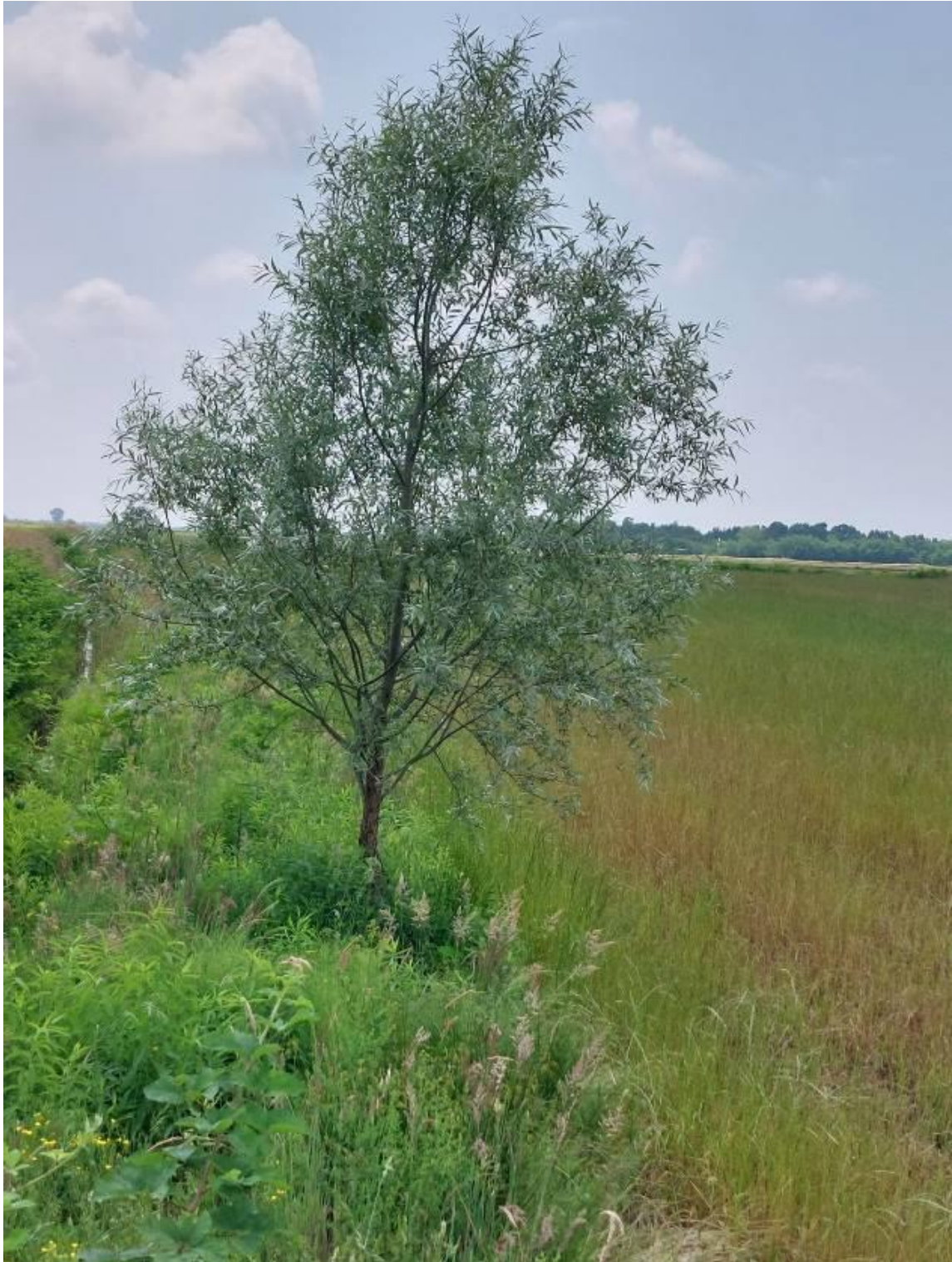
Foto 11 – Adiacente miglioramento fondiario "Sette Sorelle" : Salix alba