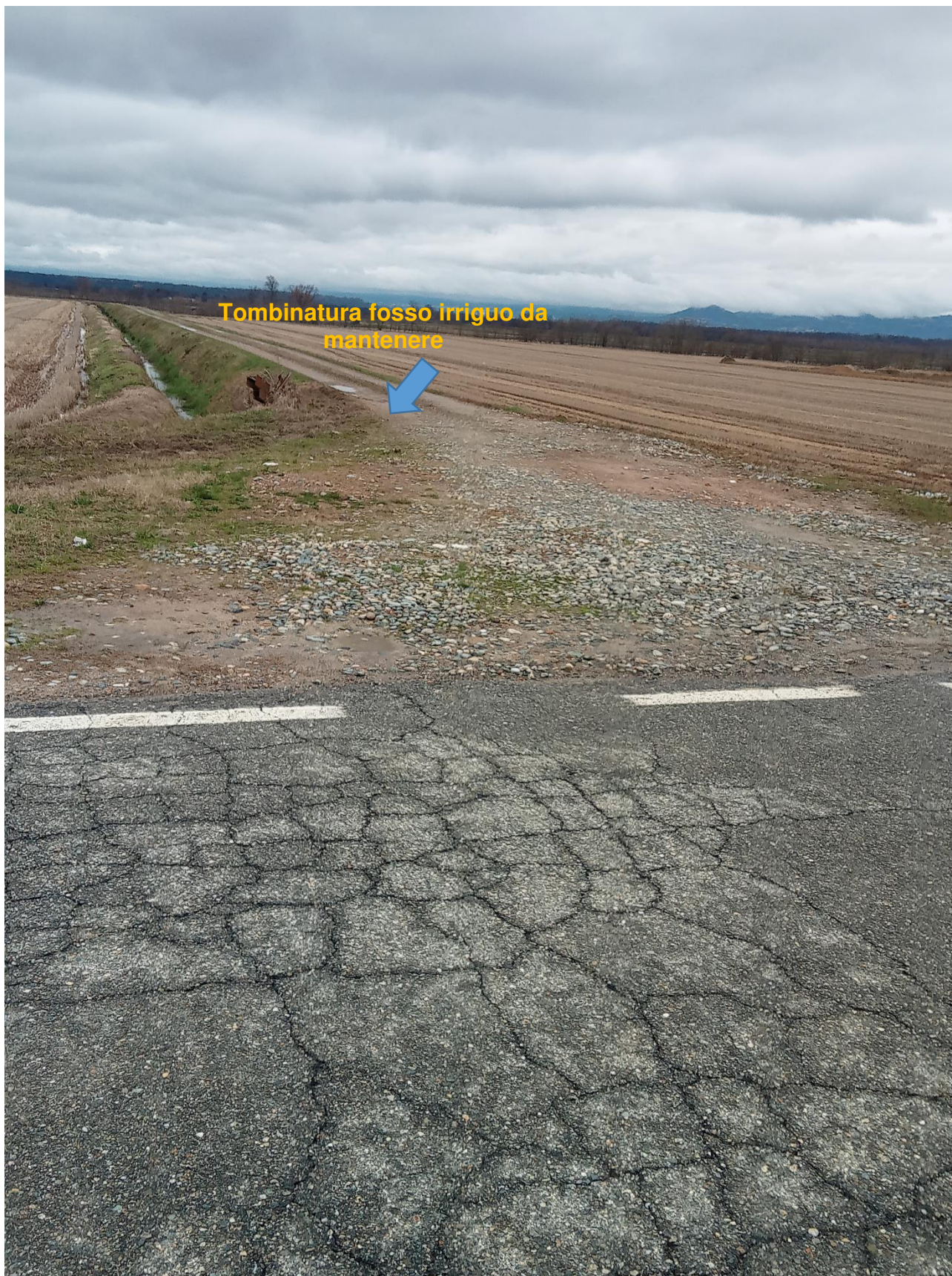
6 Foto accesso vecchia strada poderale da smantellare da SP316