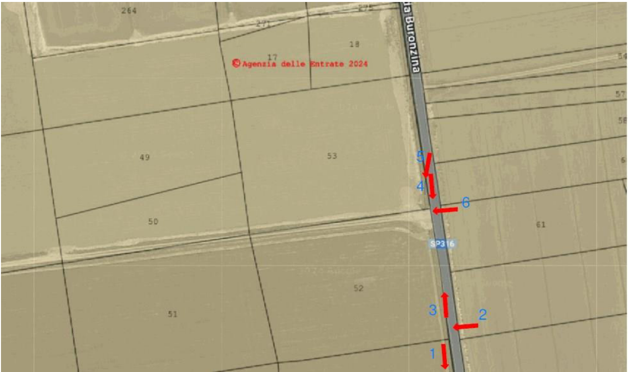
Figura 1 Punti di ripresa fotografica