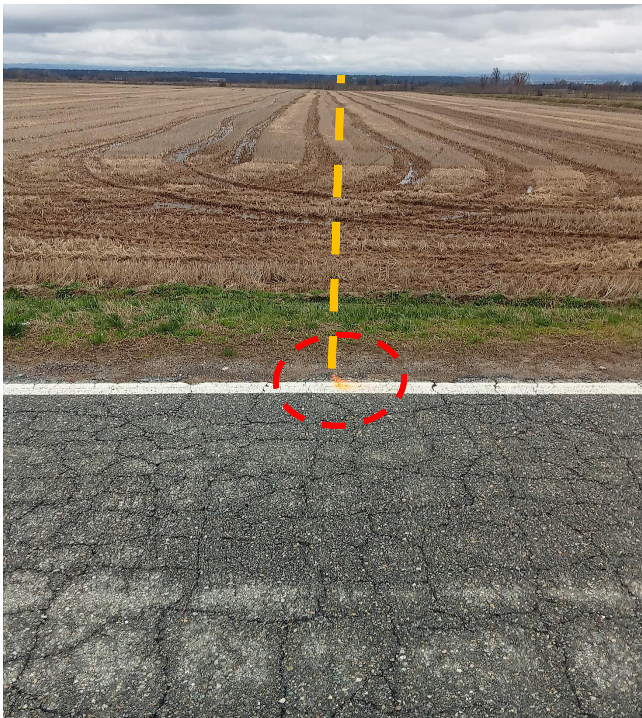
Foto n. 2 Vista da Est -Accesso nuova strada poderale su Sp 316 (mezzeria )