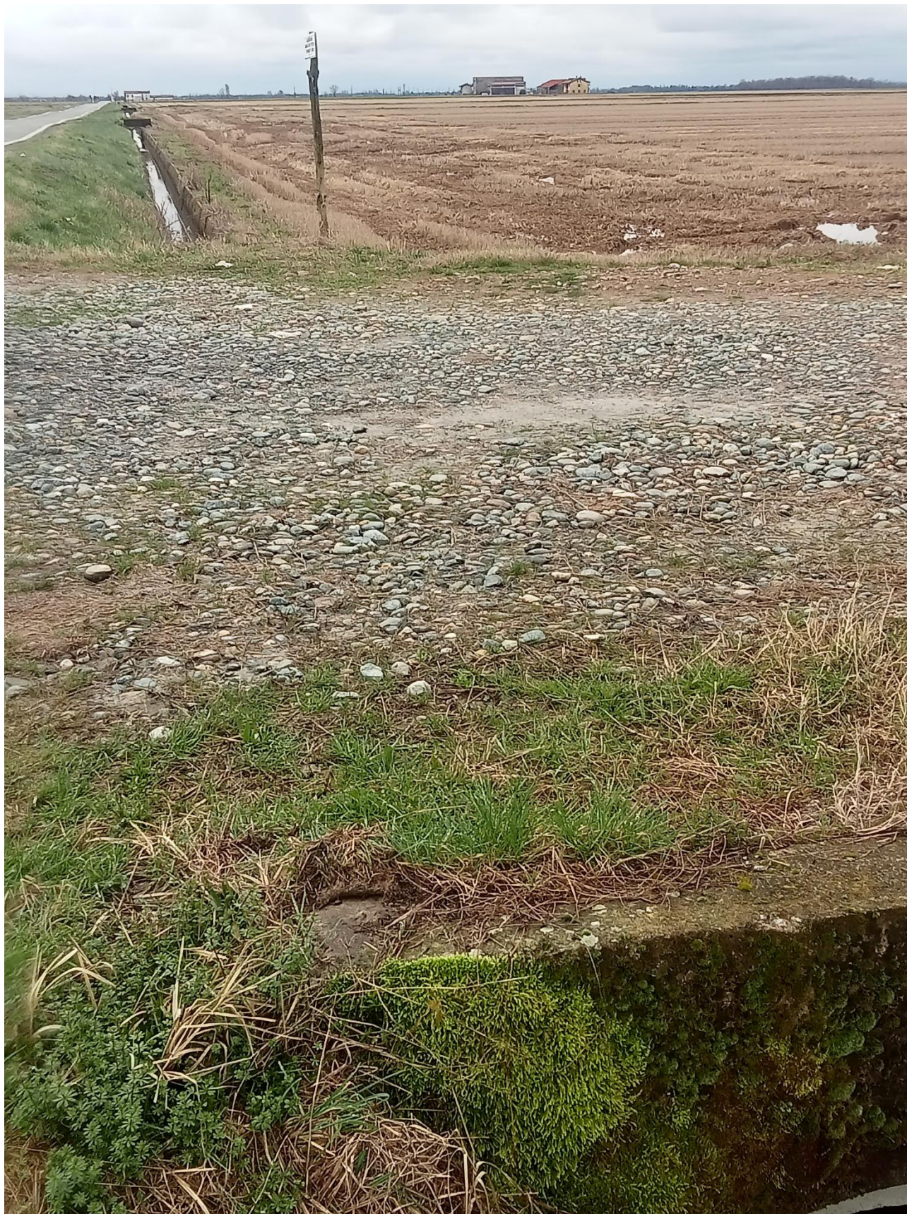
Foto n. 4 vecchio accesso strada poderale da mantellare