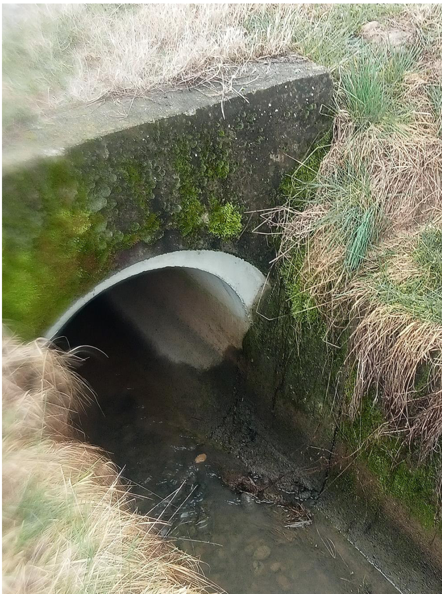
5Foto Esempio di tombinatura e spalletta 6 Foto vecchio strada interpodereale da smantellare