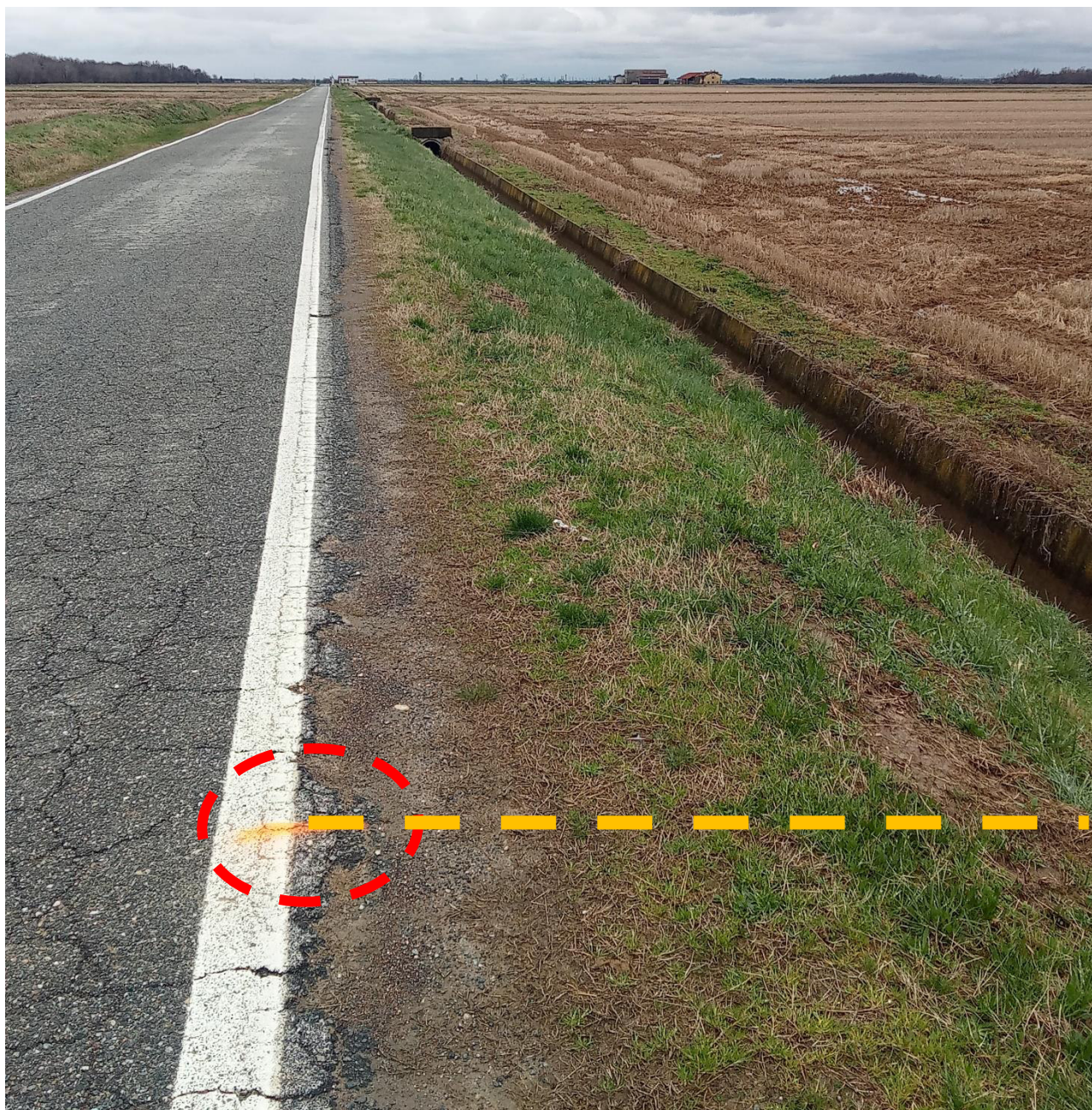
Foto n. 1 Vista da Nord -Accesso nuova strada poderale su Sp 316 (mezzeria )