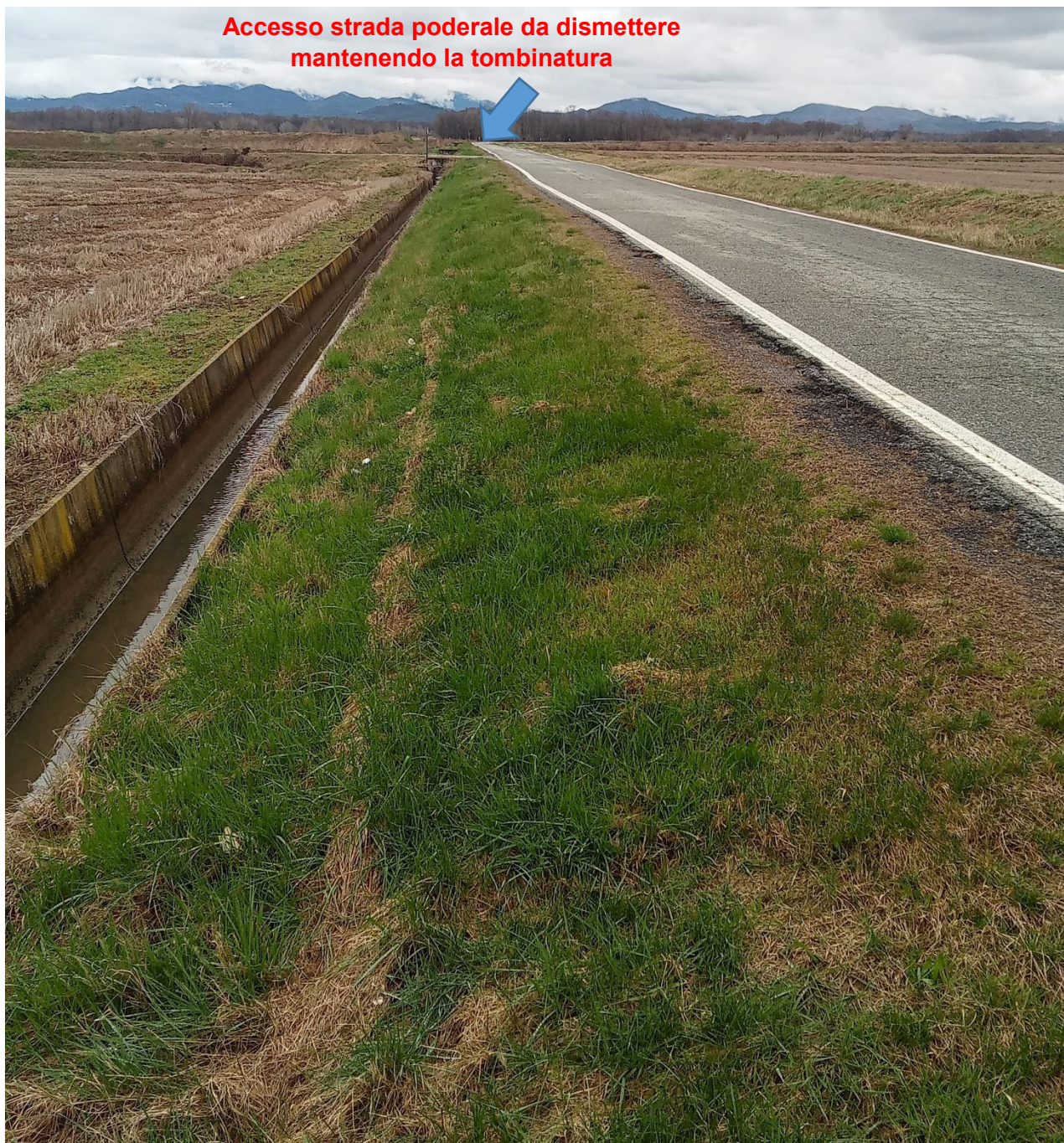
Foto n. 3 Vista da Sud Accesso nuova strada poderale su Sp 316